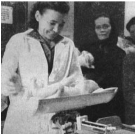
O veselju mater nad materinskimi domovi in otroškimi dispanzerji je veliko pisala Naša žena (Naša žena 1947, november, str. 341).

zadruga ali v krajevne odbore, hkrati pa je bila njihova naloga, da za delo zainteresirajo svoje može. 10