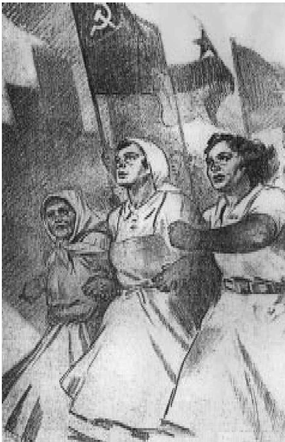
Ženske so po besedah Naše žene pogumno zakorakale v javno življenje. (Naša žena 1947, marec, naslovnica)