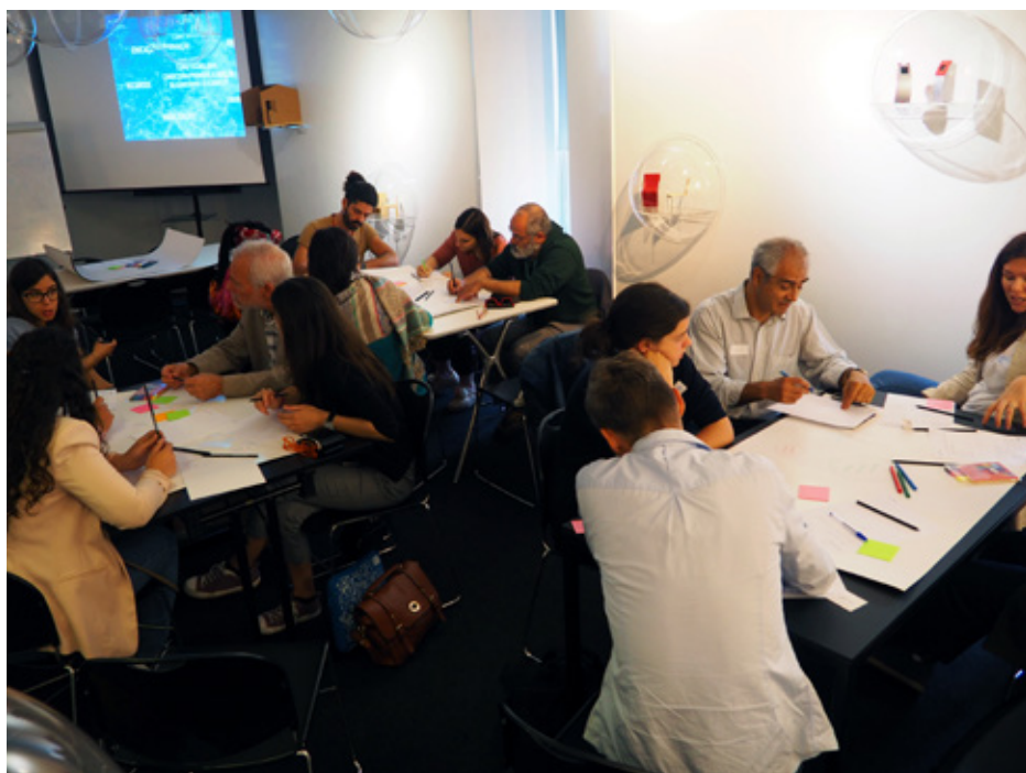
Skupinsko delo na tretji delavnici Aqua Labs; uporaba metode snovalskega (dizajnskega) razmišljanja