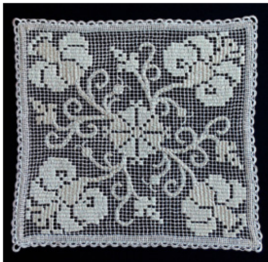
Mrežena čipka (priredba vzorca iz 17. stoletja) / bombažna tkanina, sukanci in prejica / 2016 / 18 x 17 cm

Darovalka je po svojem 50. letu začela obiskovati krožek ročnih del pod vodstvom madžarske učiteljice vezenja. Tam se je naučila več veziljskih in čipkarskih tehnik, mrežene čipke pa izdeluje zadnjih nekaj let. Spoznala jih je na Madžarskem. Vsa ročna dela ji nudijo veselje in sprostitvev, očitno tudi nekaj občutka ponosa, saj izdelke rada pokaže na razstavah. Z njimi želi v ljudeh prebuditi željo po ustvarjanju, ki človeka duhovno bogati, čeprav čas ni najbolj naklonjen ročnemu delu.