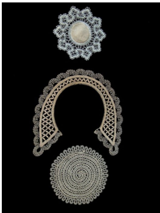
Klekljana čipka s križčevkami / bombažni sukanec, bombažno platno / premer – 14,2 cm; klekljan ovratnik z ribicami / bombažni sukanec / š – 24 cm, v – 23 cm; klekljana čipka s sukanimi slincami v spirali / bombažni sukanec / premer – 16 cm

Darovalka je tudi svojo klekljano čipko, izdelano po vzorcu podjetja DOM iz Ljubljane, dopolnila s svojo življenjsko zgodbo, v kateri se družinska dediščina klekljanja prepleta z neusahljivim osebnim veseljem do klekljanja in pisanja o njem, pa naj gre za leposlovne ali strokovne oblike literature.