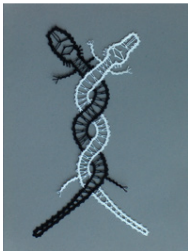
Klekljana čipka (ozki ris, kitica s pikojem) / bombažni sukanec / 2015-16 / v - 19 cm, š - 3,5 do 10,5 cm

Klekljanja se je naučila leta 2010, pomeni ji sprostitvev in razvedrilo, pa tudi potencialni vir zaslužka. Najraje izdeluje motivne čipke, nakit in modne dodatke, ki jih pokaže in deloma tudi nameni svojcem in prijateljem.