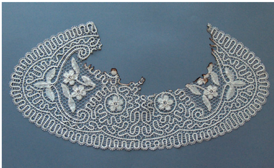
Ovalni prtiček – klekljana čipka / bombažni sukanec / š – 55 cm, v – 27 cm / 2015

Prav zapisana zgodba je čipko umestila neposredno v muzejsko zbirko čipk, skupaj z odločitvijo, da na njej ne bo poskusov restavriranja prvotne oblike – takšna, kot je, je imeniten primer muzejskega predmeta z avtorsko artikulirano zgodbo izdelovalca in uporabnika in z vsebnostjo večnivojske dediščine.