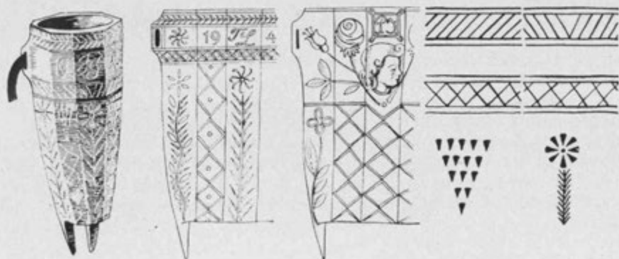
Sl. 1. Osovnik iz Gradeža pri Turjaku z različnimi okraski