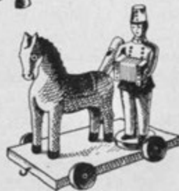
Sl. 3. Razvojne stopnje izdelave konjička (Dobrépolje); spodaj konjiček s soldatom iz Zagorice v Dobrépoljah (risal Tone Ljubič)