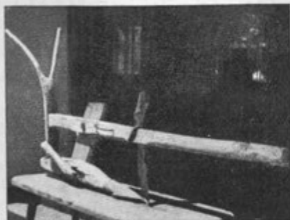
Ralo. Soboth, Avstrija (t. 52). Steirisches Volkskundemuseum, Graz (po fotografiji dr. F. Weinhardta, 1939). Ova slika odgovara Korenovu tekstu na str. 54, dok njegova sl. 16 pokazuje neku drugu spravu

Za razliku od crteža karte je ista crtačica izradila lijepo i uredno. Ipak upotrebljeni način prikazivanja nije najzgodniji. U kartama je svaki podatak