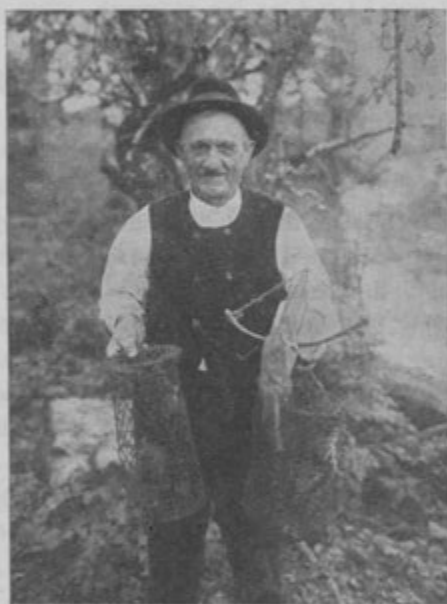
Slika 2. Polhar.

Ko pride zjutraj polhar do prve stave in vidi, da visi iz pasti tolsto telo polhovo s košatim repom, mu od veselja kar srce zaigra. Prime za prekljo, sname z nje past s polhom vred in vse skupaj po-