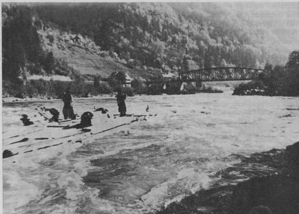
Sl. 1. Pri Podvelki (1935)

Glede hrane se Leskoschkova izvajanja ujemajo 66 z že znanimi ustreznimi spoznanji. 67 Edinole »prenosna pečica za kuho«, ki jo Leskoschek navaja 68 po Paherniku, 69 pomeni nadaljnjo zmoto. Ohranjeno ustno izročilo je ne spričuje, marveč se spominja le ognjišča na »tragah«, kakršno so lahko prenašali, če so nasedli 70 (ognjišče je bilo na levi strani »sprednjega kraja«, pred huto; kuhal je vsak zase).