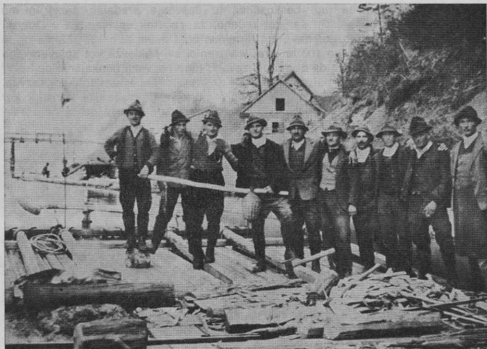
Sl. 3. Pristanek pri Borlu (1932)

stranski oltar posvečen temu svetniku, da so 1668 brali tam mašo na dan sv. Aleksa in da je bil 1724 v podružnici na Radlju oltar sv. Aleksa. 104 Ne glede na to, da ohranjeno ustno izročilo ne spričuje čaščenja sv. Aleksa v obravnavani družbeni skupini, veljajo za Leskoschkovo sklepanje mutatis mutandis gornje pripombe glede čaščenja sv. Miklavža. Če je ob tem na voljo še podatek, da so šteli dravski splavarji sv. Aleksa za varuha zoper neurje, sprejemam ta podatek s pomisleki, saj ga je prispeval Leskoschkov prevajalec, 105 o katerem naj mi bo dovoljeno imeti svoje mnenje.