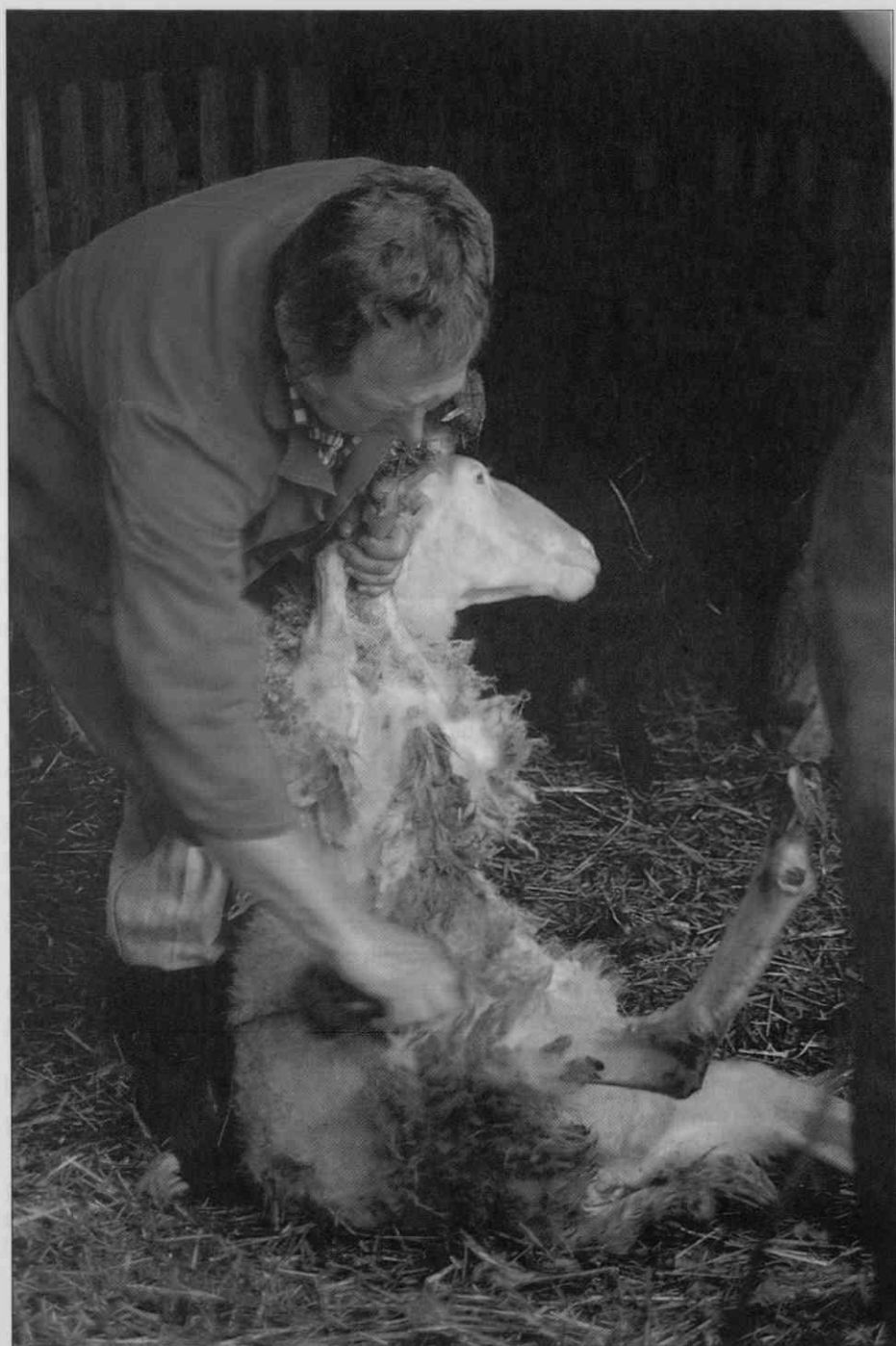
Najprej je treba postržiti trebuh. Striža pri Sedmakovih. (Foto I. Smerdel, 1990) • Shearing starts at the belly and that's how the Sedmaks do it. (Photo I. Smerdel, 1990) • D'abord il faut tondre le mouton sur le ventre. Le tondage chez la famille Sedmak. (Photo de I.Smerdel, 1990).