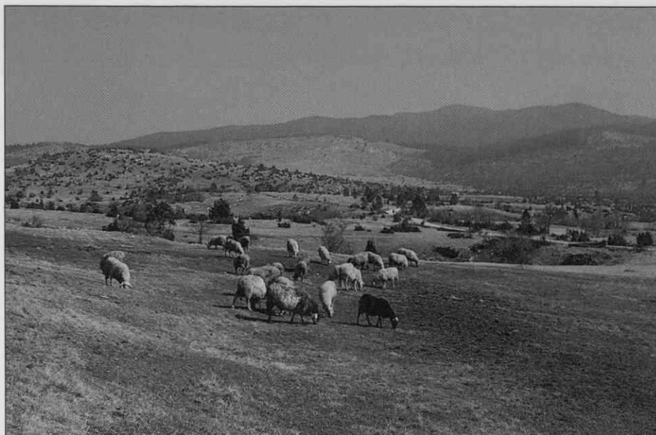
"Šajnovce" ovce na zgodnji spomladanski paši na jurški gmajni. (Foto I. Smerdel, 1990) • "Šajn's" sheep grazing in early spring. (Photo I. Smerdel, 1990) • Les moutons de "Šajn" pendant la pâture de printemps à la campagne de Jurišče. (Photo de I.Smerdel, 1990).

Ograjen pašnik je površina, na kateri ovce podnevi čakajo svojega gospodarja in ponavadi hkrati tudi pastirja, da se vrne iz službe in gre z njimi na pašo ali da gre po jutranji paši opoldne domov na "južno" ter jih ob vrnitvi znova pospremi po planjavah. Noč prebijejo v štalah, najsibodo te v sklopu domačije ali sredi pašnih površin. Izjemi takšnega sistema pašništva sta le tropa (mesnih ovc) Ivana Širca iz Strmice in Alberta Zadela z Belskega. Njune živali se od 25. aprila tja do srede oktobra pasejo kar same, brez pastirja ali psa, na prostem od jutra do jutra, na Planinski gori (pred desetimi leti na sto hektarjih urejenem pašniku, prvotno le za plemenske telice). Izmed lastnikov (ali njihovih družinskih članov) mesnih ovac se s pašo verjetno še največ ukvarja Fani Dekleva iz Slavine, edina ženska pri tem delu, edina pastirica ovčarka. Zjutraj odhaja k ovcam, ki prenočujejo v štali na obrobju selške gmajne, jih žene na pašo, jih opoldan zapre, gre domov skuhat južino in se popoldan, sama ali z možem (ki je medtem prišel z dela), spet vrne past do večera. Drugi rejci samo mesnih ovc so povečini vsi polovico dneva po službah.