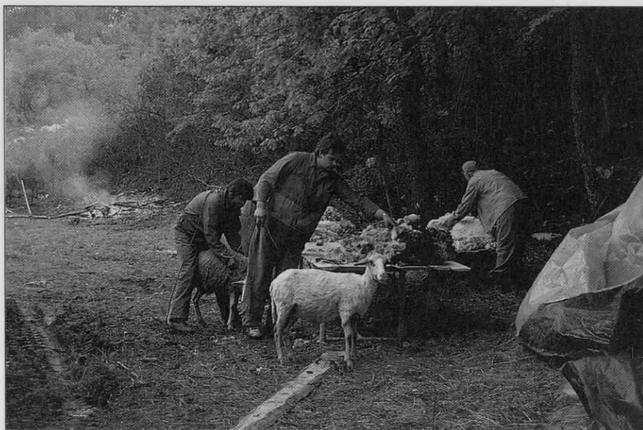
Striža pri Daretu Deklevi iz Slavine. V ozadju se dimi žerjavica, nad katero bodo na ražnju spekli jagnje. • Dare Dekleva from Slavina shearing sheep. The smoke in the background rises from the burning ashes over which a lamb will be grilled. • Le tondage chez Dare Dekleva de Slavina. Au fond, on aperçoit la braise fumante au-dessus de laquelle on fera rôtir un agneau..

dinarjev (okrog 1 DEM, spomladi 1990). Ker z ene ovce postrijejo približno za dva in pol kilograma volne, so besede Jožeta Žužka iz Slovenske vasi kar žalostno resnične: "Jest moram pet vouc ustričt za enkrat sebe ustričt."