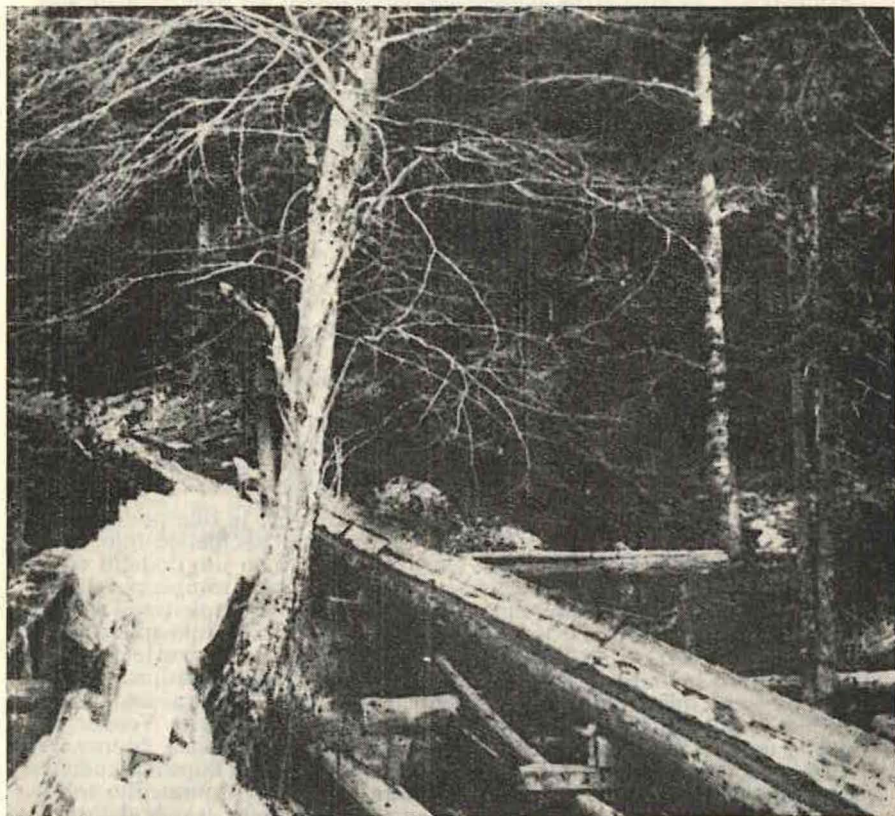
Del riže s Pevčeve bajte v Zgornjo Bistrico, postavljene 1904, podrte 1955