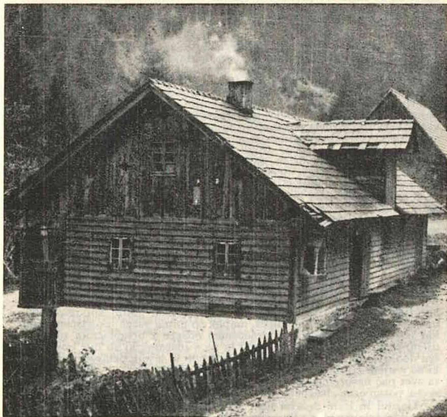
Hiša lesnega delavca Lukanja nad Oplotnico