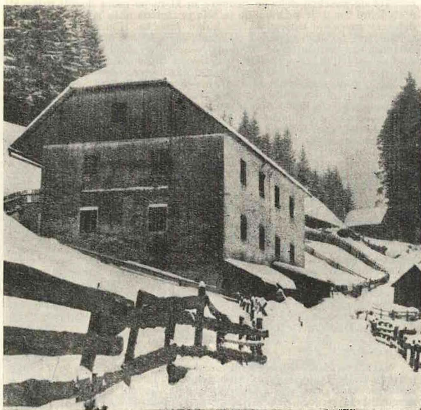
Večstanovanjska hiša gozdnih delavcev, predelana konec 19. stoletja iz šolskega poslopja v nekdanjem steklarskem naselju Rakovec nad Vitanjem