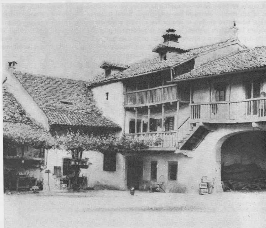
Hiša v Zirjah.

Slovenije, v Beogradu, Subotici, v Trstu in Gorici (Italija) v Baslu in Auvernieru v Svici, Ingelheimu in Münchenu v Zah. Nemčiji in v Gradcu (Avstrija) 26 občasnih razstav.