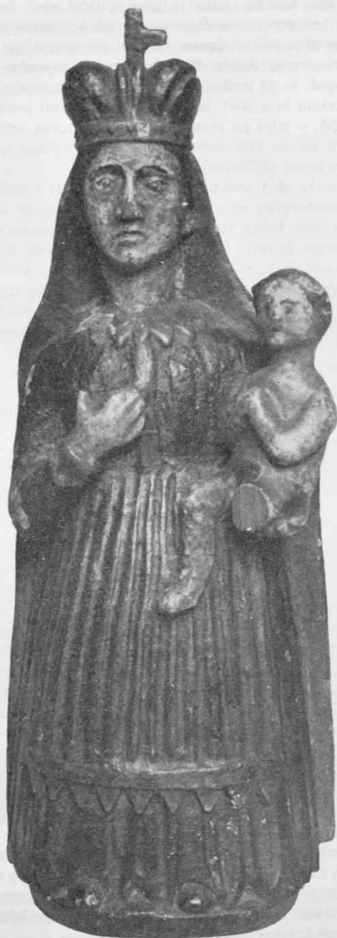
Z razstave Slovensko ljudsko kiparstvo: Marija z detom. Iz hišnega oitarčka Dolenjska, 19. stol.