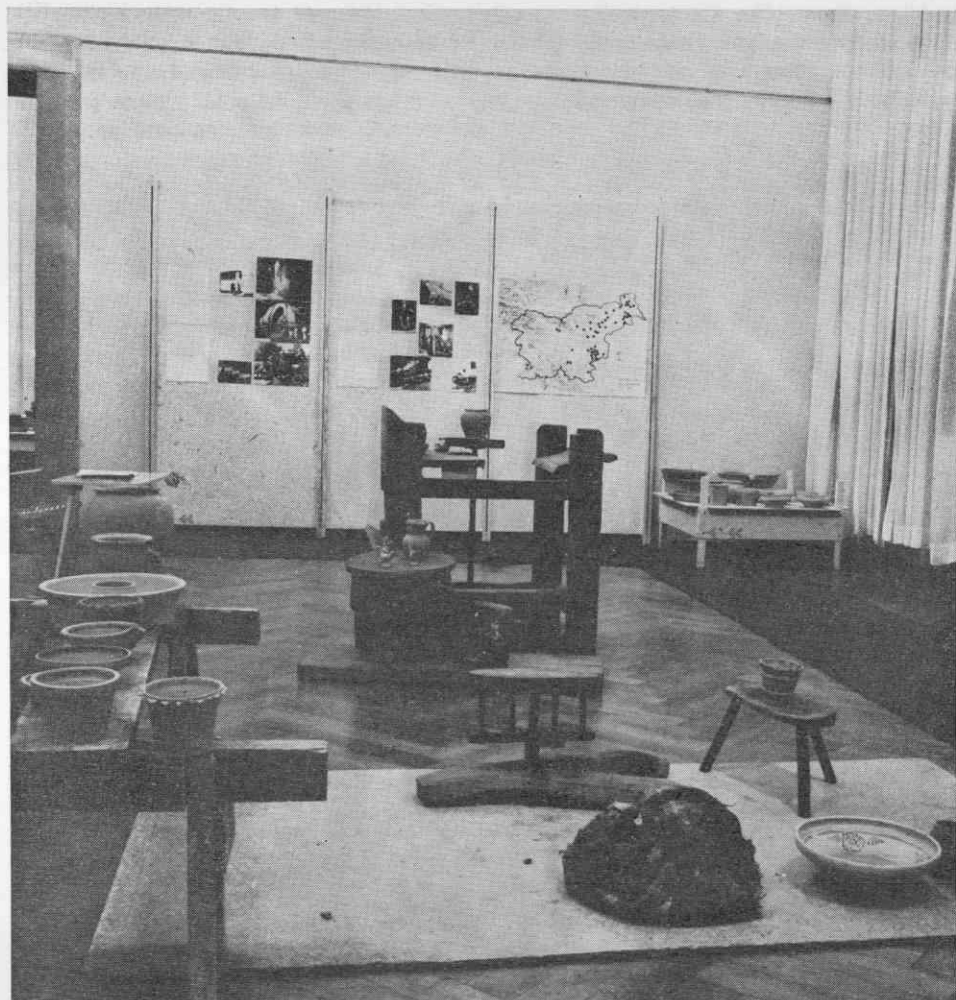
Posnetek z razstave.