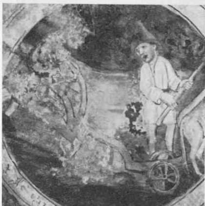
Z razstave Ralo in plug: Upodobitev pluga v Hrastovljah 1490

Razstava je bila odprta od 11. oktobra do 31. decembra 1968. Prikazala in razložila je značilna orna orodja na Slovenskem od zgodnjega srednjega veka do dobe po osvoboditvi. Razstavljeni so bili številni ohranjeni primerki plugov in ral iz zbirke Slovenskega etnografskega muzeja, arheološko gradivo in upodobitve začenši s poznosrednjeveškimi stenskimi slikami in bogato fotografsko gradivo. Razstava je predstavila poglavitno gradivo o ralu in plugu, ki je bilo doslej zbrano pri Slovencih, hkrati pa je dala tudi najpomembnejša spoznanja o tem orodju in njegovemu razvoju do današnjih dni. Razstavo je pripravil znanstveni sodelavec muzeja dr. Angelos Baš. Ob razstavi je izšel tiskani katalog.