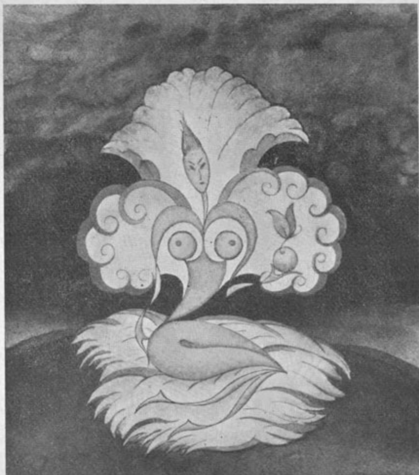
Sodobni ornamentalni motiv »Eva«. Iz nekdanjega motiva Eve, kot znak ženske lepote in zapeljivosti, je tu Eva podana analitično in simbolično samo kot žena vir človeškega rodu