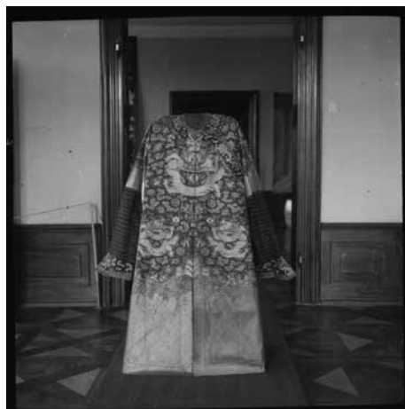
Kitajski dvorni moški kaftan, Kulturno-zgodovinska zbirka Kitajske , Goričane, 1966 (Dokumentacija SEM)