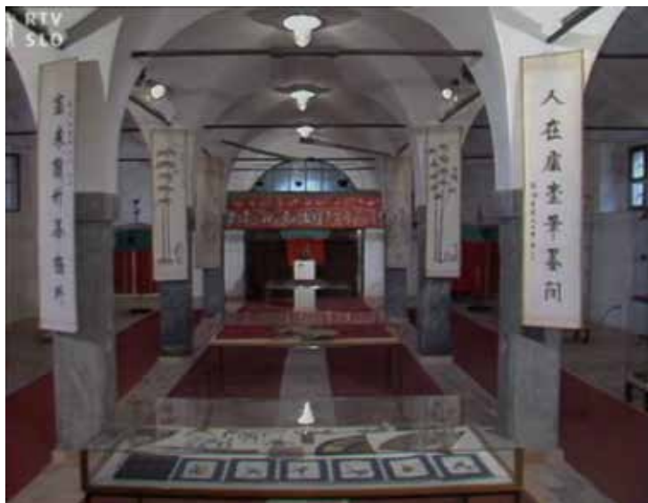
Razstava o slovenskih zbiralcih kitajske kulture, Galerija neuvrščenih, Goričane, 1989 (fotogram iz TV oddaje Oči kritike , 29. 6. 1989)