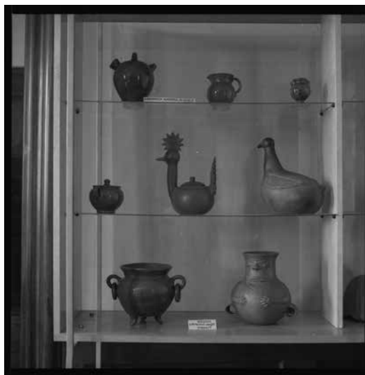
Keramični izdelki na razstavi Čilska ljudska umetnost , Goričane, 1969 (Dokumentacija SEM)

različnih predelov Republike Čile in Velikonočnih otokov, ni pa navedel, kateri muzej je posredoval muzealije.