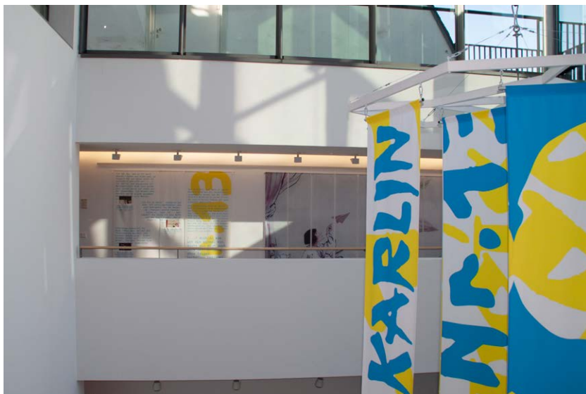
Pogled na razstavo Alma Maximilijana Karlin – pisateljica, Haus am Dom, Frankfurt.

Südsee I. in II., Der Todesdorn und andere seltsame Erlebnisse aus Peru und Panama ... ), ki so bila izdana v zgodnejših 30. letih 20. stoletja in med bralci doživela lep uspeh. Snov za roman Der Götze (1932) in Isolantis – roman o potopu celine (1936) črpa iz širokih duhovnih, tudi teozofskih obzorij in mističnih doživljanj. O magični moči duhovnega govori tudi delo Der blaue Mond: eine Erzählung für Jung und Alt (1938). V 40. letih je Alma M. Karlin zaradi pretresa druge svetovne vojne izdala le nekaj posameznih del, a še vedno vneto zapisovala in pisala vse do svoje smrti.