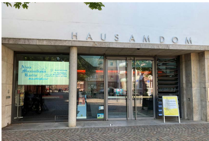
Razstava Alma Maximilijana Karlin – pisateljica je bila na ogled v Haus am Dom, Frankfurt.

Osrednji del razstave z naslovom Svet v mojih knjigah predstavlja izdaje knjig, v prvem delu so obravnavani prvenci iz zgodnejšega obdobja (1918–1950), v drugem dela, ki so prvič izšla šele po pisateljicini smrti (1950–2023). Z izbranim spremnim gradivom je predstavljenih 36 prvih izdaj knjig, predvsem potopisi iz 30. let 20. stoletja, ki so jih lepo sprejeli tudi založniki in bralci. Snov za literarni prvenec Die Kringhäusler: drama in drei Akten (1918) je Karlinovi ponudilo domače okolje v Celju, delo Mein kleiner Chinese (1921) pa temelji na osebni izkušnji. Sledi njen osupljiv ustvarjalni opus, navdahnjen z doživetji in spoznanji raziskovalne poti okoli sveta, iz katere je črpala snov za večino svojih del ( Einsame Weltreise, Im Banne der Südsee, Drachen und Geister, Mystik der