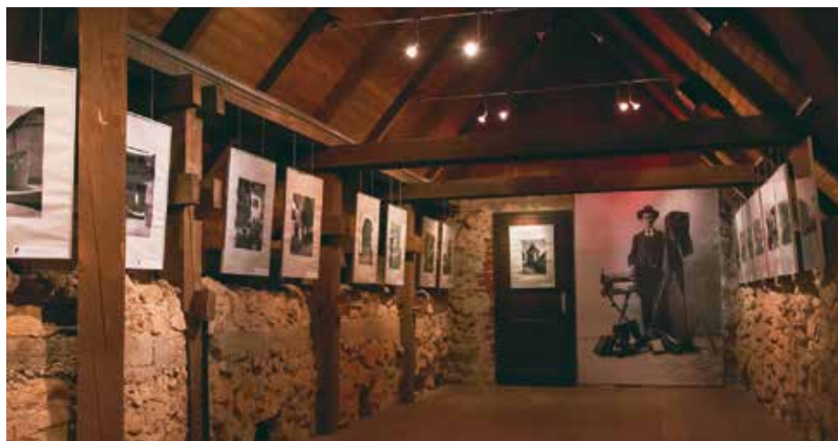
Pogled na razstavno postavitvev Nagličevih fotografij v galeriji Nad velbom na Šmarni gori

Od 5. oktobra 2014 do novembra 2015 je bila v Galeriji Nad velbom na Šmarni gori na ogled fotografska razstava z naslovom Družinsko romanje na Šmarno goro, Fotopis Petra Nagliča iz leta 1933 . Gre za izbor iz Nagličevega bogatega fotografskega opusa, zaokroženo celoto, ki jo je uredil in opremil s komentarji že avtor sam.