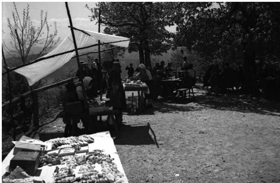
Kramarske stojnice z lectom in spominki na Šmarni gori leta 1933

Sledijo opisi posameznih posnetkov, na koncu dnevnika pa zapiše še nekaj informacij o Šmarni gori: “Šmarnagora je zelo obiskana božja pot, ki jo posebno radi ljubljancane obiskujejo je zelo staro svetišče posvečeno Materi Božji, okrog in krog obdano z močnim obzidjem še iz za turških napadov. Ob svetovni vojni je vzela vojaška oprava zvonove in sedaj so jih pa že zopet nove bronaste skoraj iste teže napravili ki prav prijetno pojo.”