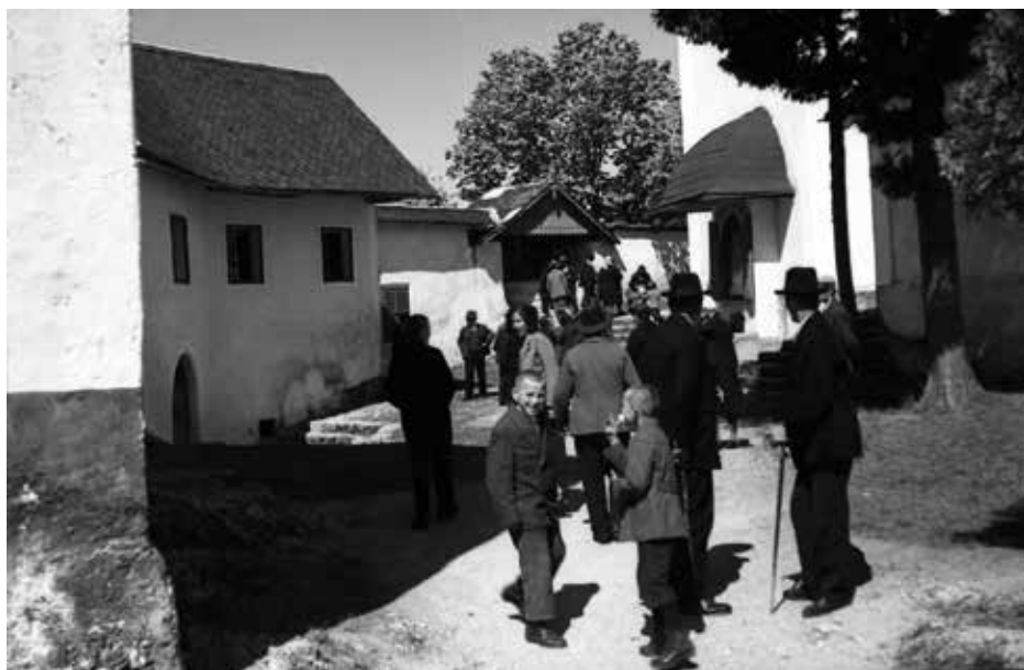
Romarji pred šmarnogorsko cerkvijo leta 1933 (Dokumentacija SEM)

Tematsko lahko Nagličevo fotografijo v grobem razdelimo na portretno, krajinsko, arhitekturno in dokumentarno. Veliko večino njegovih posnetkov lahko uvrstimo v dokumentarno fotografijo, s katero je beležil tako vsakdanje kot tudi slovesne dogodke v ožji in širši okolici. Fotografiral je šege letnega in življenjskega kroga v svoji okolici, društveno in družabno življenje, domačo ščetarsko obrt in gradbene posege, povezane z njo, zabeležil je obdobje prve svetovne vojne, ki jo je preživel na Ljubljanskem gradu. Velik del Nagličeve dokumentarne fotografije pa lahko posredno ali neposredno povežemo z verskim življenjem in krščansko tematiko; v mislih imamo predvsem številna romanja, od bližnjih krajev pa vse do Jeruzalema, razne cerkvene slovesnosti in kongrese, blagoslove, pogrebe cerkvenih dostojanstvenikov in še bi lahko naštevali.