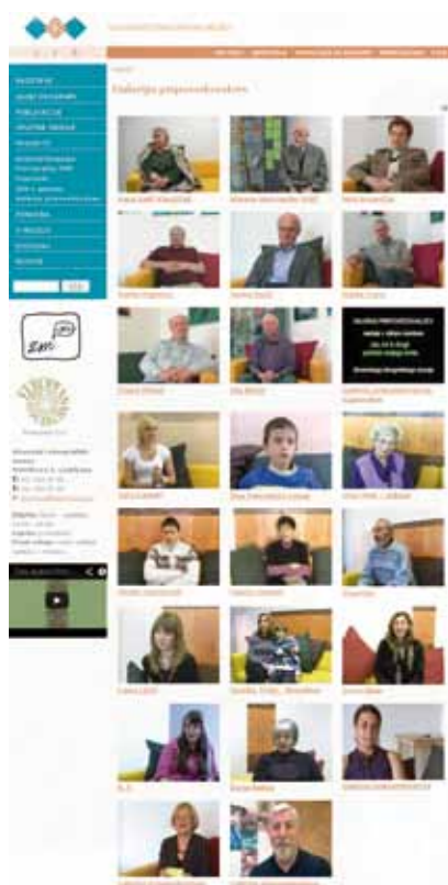
Galerija pripovedovalcev na spletni strani SEM. Zamisel Nadja Valentincič Furlan, urednik Gregor Ilaš, 2013.

Vsako leto posnamemo od šest do osem pripovedi. Posneto gradivo in urejene pripovedi hranimo v kustodiatu za etnografski film. Pripovedi objavimo v Galeriji pripovedovalcev (2010–2013) 12 na enoti Odzivi obiskovalcev na drugi stalni razstavi in na spletni strani SEM (Internetni vir 6).