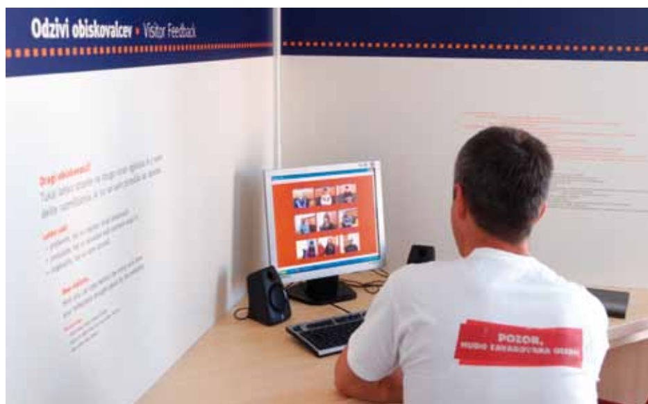
Obiskovalec pregleduje pripovedi na enoti Odzivi obiskovalcev v zaključku razstave Jaz, mi in drugi: podobe mojega sveta .