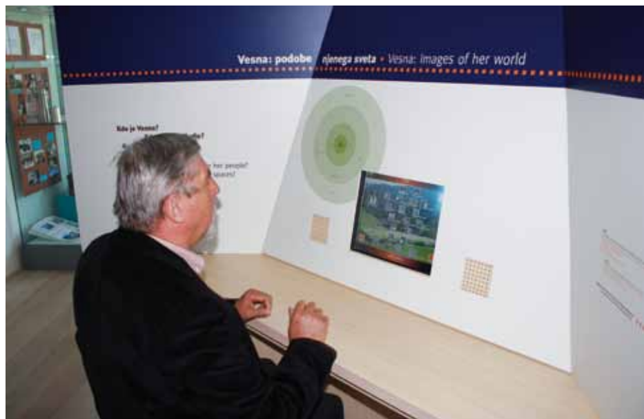
Umeščenost izbirne enote Vesna v izteku razstave Jaz, mi in drugi: podobe mojega sveta .