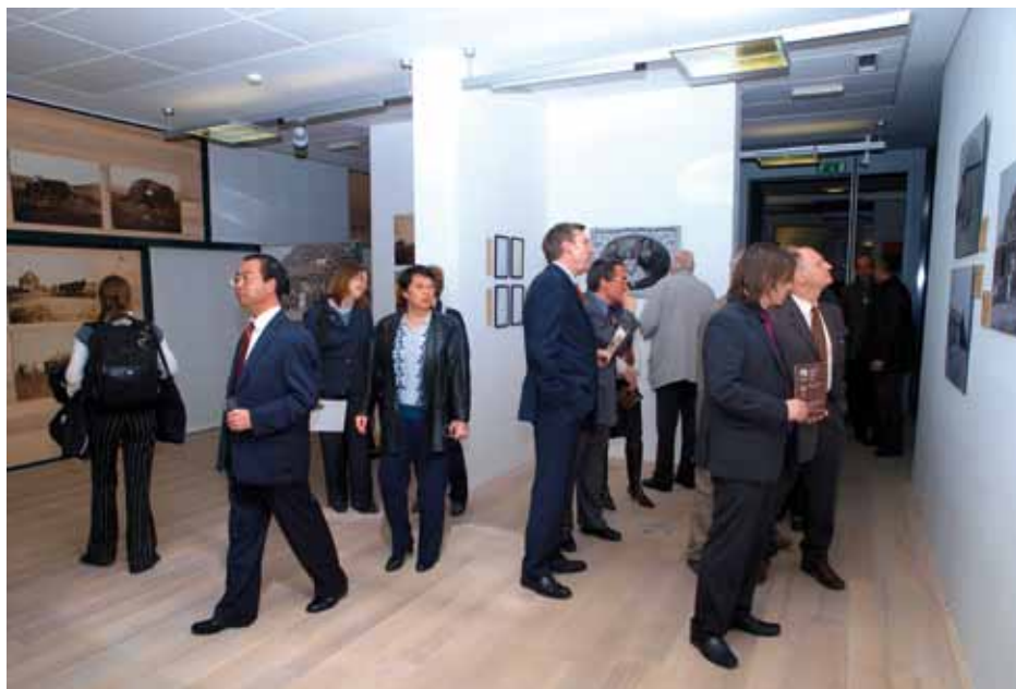
Sprehod po razstavi " The American Frontier "