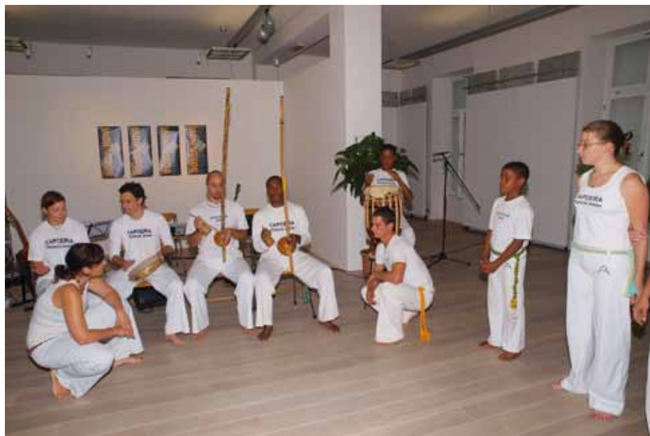
Program na odprtju razstave Poklon bossi novi (Dokumentacija SEM)