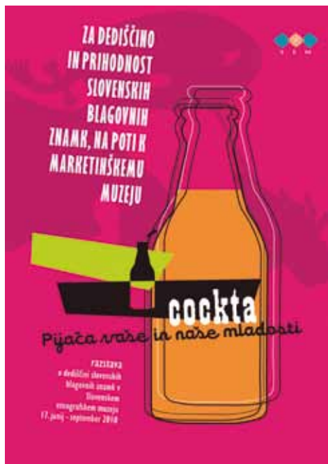
Naslovnica zloženke ob razstavi Cockta – pijača vaše in naše mladosti

znamke pomembne. Dejstvo je, da je Cockta simbol slovenske potrošniške revolucije in da ostaja najznačilnejša predstavnica koncepta 'slovenska znamka'. Njena vloga za naš gospodarski in družbeni razvoj je nesporna. Raziskovanje zgodovine slovenskih znamk in razstava Cockta, pijača vaše in naše mladosti sta zato predvsem izraz spoštovanja do vseh, ki so ustvarjali in razvijali Cockto in druge znamke, ki so postale del naše kulturne identitete in nas prijetno spominjajo na čase gospodarskega in družbenega razcveta. Na poti k marketinškemu muzeju je razstava s Cockto naznanjala mladost, nove sveže ideje za ohranjanje in prihodnost dediščine slovenskih znamk.