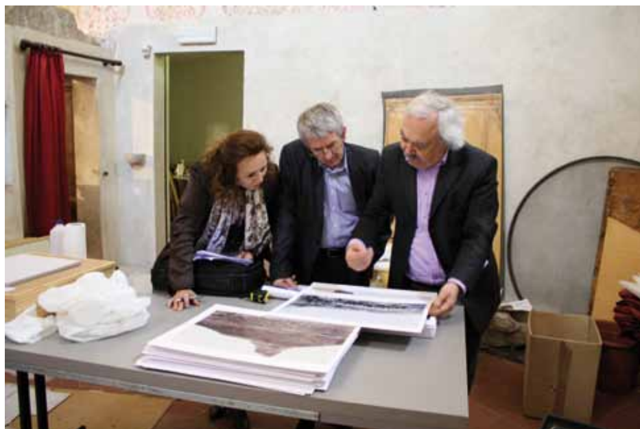
Priprava skupinske razstave Utrinki Afrike v italijanskem San Vitu