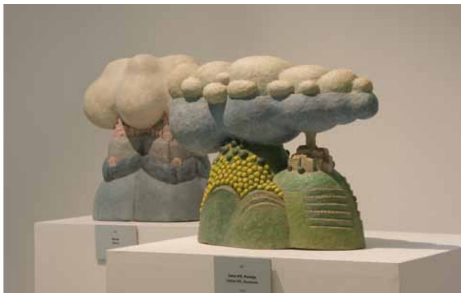
Kipa Petra Černeta na razstavi Videti, česar znanost ne vidi

Kulturne krajine tretjega sklopa so bile upodabljane kot človeška poprsja: spodnji del je kot hrib, strnjeno naselje je kot glava in nebo kot pokrivalo. Na izviren način je umetniško čutno-čustveno-miselno izražen današnji značaj takšnih primorskih motivov.