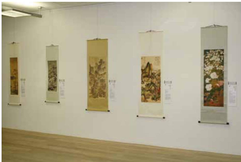
Reprodukcije iz zbirke Narodnega muzeja v Tajpeju na razstavi Lepota kitajskega slikarstva

Tajvanskim raziskovalnim centrom Filozofske fakultete v Ljubljani organiziral še simpozij Tajvan II .