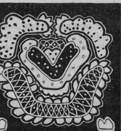
Barokni ukrasni motiv sa poculice iz Siska

U pitanju samog baroka možemo najevidentnije pratiti uslove kako i na koji način seljačka umetnost apsorbuje elemente kulturne umetnosti. A što je još glavnije: u kojoj meri.