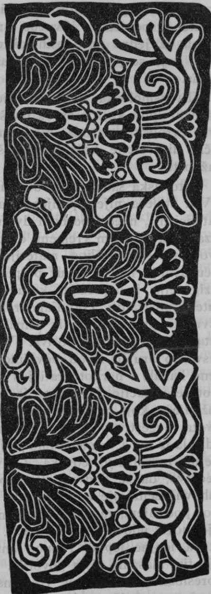
Sl. 1. Barokni ukrasni motiv sa poculice iz Boka (opć. Palanjek, srez Sisak)

Čitavu pojavu protureformacije treba svesti na potpuno izmenjenu psihičku dispoziciju, koja se stvorila na izmenjenim socijalnim i ekonomskim odnošajima o kojima je već bila reč. U tim novim odnošajima, u kojima je umetnost protureformacije bila kulturno najvidnije obeležje, ima još niz kulturno-socijalnih komponenta, koje je rimska crkva, jednako kao i umetnost, vešto iskoristavala u svoje svrhe. To je sve; ali sama umetnost nije izrasla iz nekih potreba crkve, nego iz novih kulturno-socijalnih relacija, koje su prerasle umetnost i život renesanse. I tu je sasvim ispravna konstatacija Wernera Weisbacha: 1 »Kao što je iz religijskog središta protureformacije proizašao ideal pobožnosti, koji je odgovarao duševnoj strukturi ondašnjeg čovečanstva a koji je imao uporište u tradiciji, tako je zapalo umetnost, da ovaj ideal, u izražajnim formama tradicionalnog značenja, dovede do izražanja. A kako je pokret bio jedinstven i univerzalan i prostirao se preko svih katoličkih zemalja, to su i posledice bile svugde jednake. Kao što se vidi