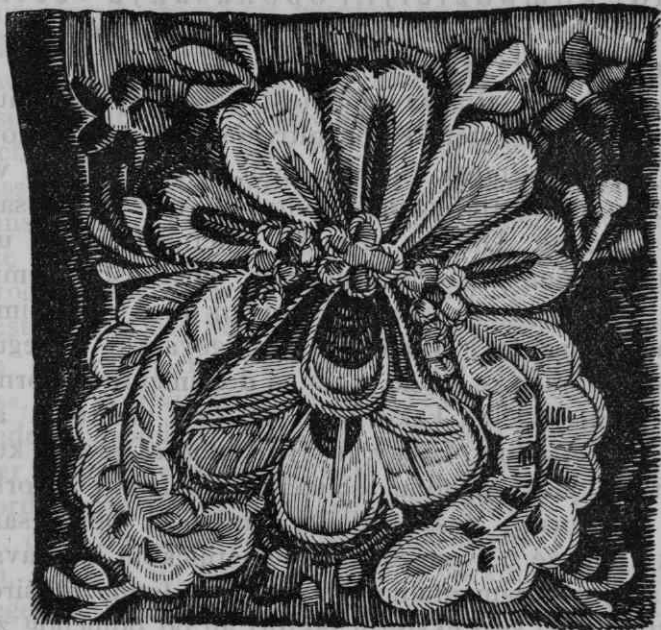
Sl. 5. Vezeni barokni ukras sa poculice iz okolice Siska

Prema tome se vidi, da seljačka umetnost, dok u njoj prevladavaju tradicionalne i primitivne odlike, može da od kulturnih umetnosti asimilira samo ukrasnu stranu, koja joj je psihološki najbliža, dok ostale odlike umetničkog tipa, koji traži veće plohe za konstrukciju ne samo da ne može apsorbirati,