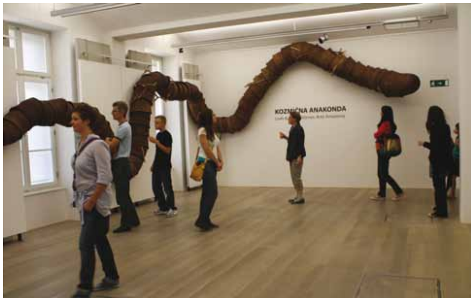
Umetniška instalacija Kozmična anakonda , ki je nastajala pred očmi obiskovalcev ob prireditvi Arte Amazonia.

ZGODBE LESA: interpretacije razstave Orinoco , razstava (7. oktober–15. november 2011)