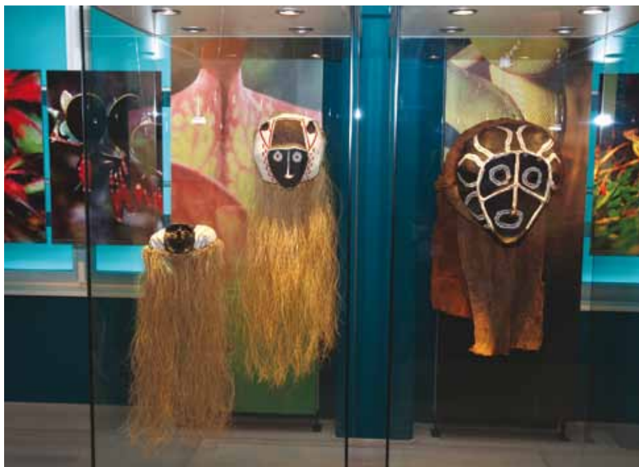
Detajl z razstave Orinoco .

Venezuelsko staroselsko prebivalstvo, ki živi v porečju Orinoka, je eno najmanjših v Latinski Ameriki. Sestavljajo ga majhne etnične skupine, vsaka s svojim jezikom in družbenim sistemom. Čeprav so se danes mnoga ljudstva že prilagodila novi družbi in opustila številne sestavine svoje kulture, so druga ohranila svojo identiteto in razvila nove oblike, nekatera pa so celo izginila. Amazonski Indijanci so vedno živeli daleč od gosto naseljenih središč in se preživljali z lovom, ribolovom in obdelavo zemlje. Po njihovem videnju sveta ljudje in narava skupaj tvorijo celoto, v kateri ima vse svoje pravo mesto.