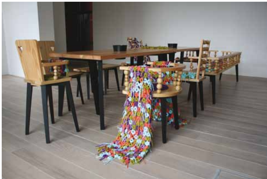
Gostujoči umetniški projekt Cvetnoetno . (Dokumentacija SEM)

Gostujoči umetniški projekt etno pohištva je povezal sodobno oblikovanje s slovensko kulturno dediščino in tradicionalnimi znanji s področja lesarstva in tekstilstva.