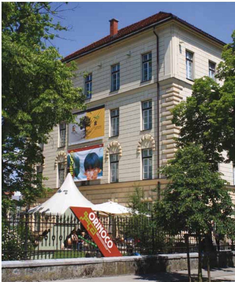
Razstava Orinoco je privabljala obiskovalce v Slovenski etnografski muzej več kot eno leto. (Dokumentacija SEM)

Razstava je pripovedovala o sonaravnem življenju dvanajstih etničnih skupin, ki že stoletja živijo ob reki Orinoko v južni Venezueli. Skupine De'áruwa (Piaroa), Ye'kuana, Yanomami, Híwi (Guahibo), E'ñepa (Panare) in Hodi živijo v porečju Orinoka v Amazoniji. Wakuenai (Curripaco), Baniwa (Baniva), Baré, Puinave, Warekena in Tsase (Piapoco) so z območij Gvajane in Rio Negra amazonskega porečja v Braziliji in Kolumbiji.