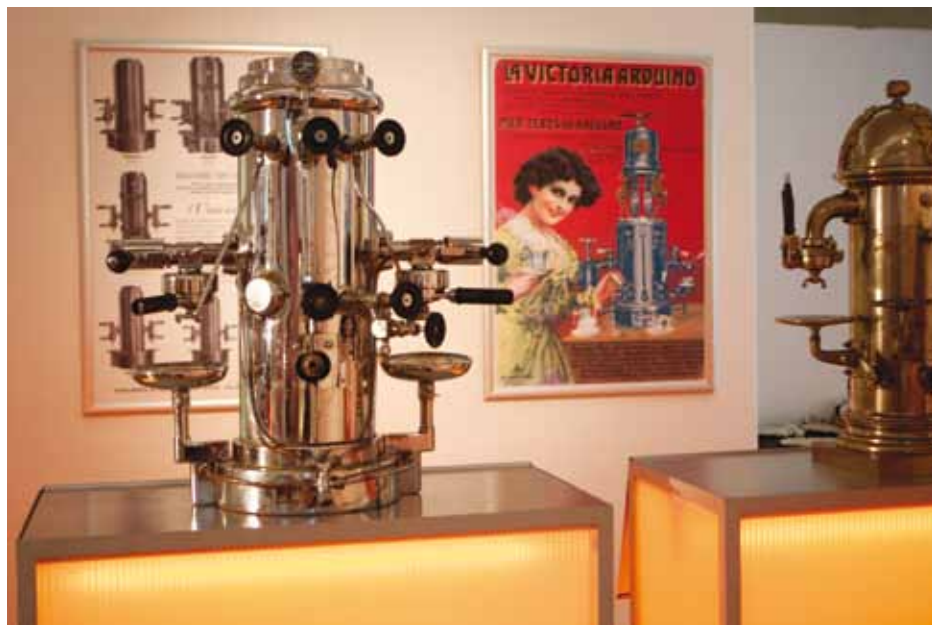
Pogled na razstavo Stoletje italijanskega espressa.