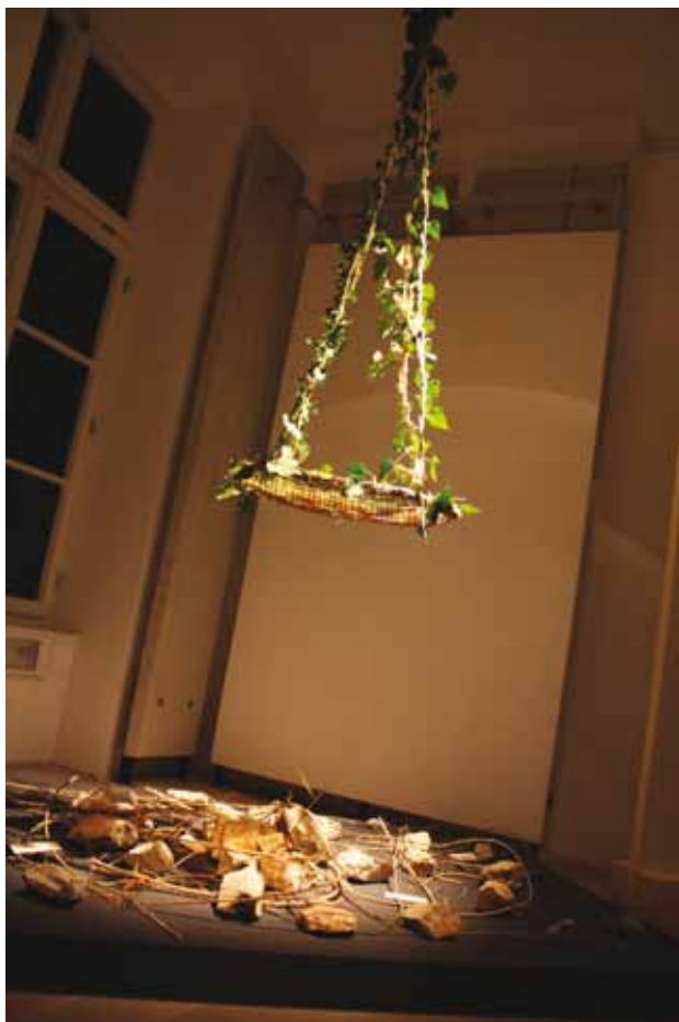
Ena izmed instalacij na razstavi Zgodbe lesa . (Dokumentacija SEM)

SHOW ME YOUR DREAM , razstava projekta A.L.I.C.E. (17.-27. november 2011)