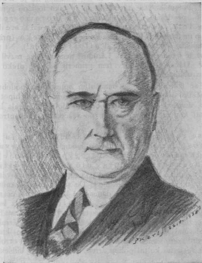
Sl. (Fig.) 1. E. Dubois

le še dve dejstvi: da gre za izredno fosilizirane najdenine ( Mollison pravi, da je kanamski odlomek mandibule najbolj fosilizirana kost, kar jih je imel v rokah; za ta del se strinja tudi Boswell v omenjenem pismu, l. c.!) in da gre brez dvoma za pripadnika rodu Homo ! Nadaljnja najdenina, ki je povzročila več vprašanj,