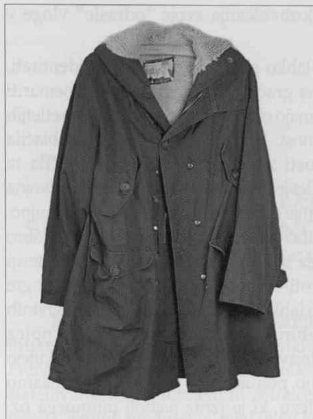
Zimska jakna. Olivno zelen bombaž, bela sintetična plišasta podloga, plastični gumbi, kovinski pritiskači in zadruga. Konfekcijski izdelek. Dolžina 88 cm.