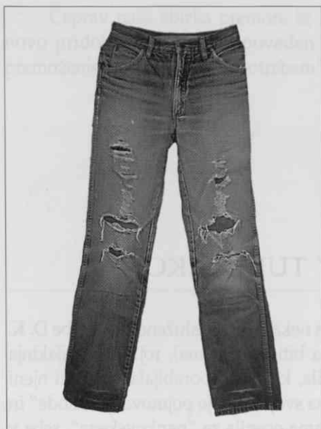
Kavbojke znamke Wrangler. Bombažni jeans svetlomodre barve, všite bombažne krpice raznih barv, kovinska zadrga in zakovice. Konfekcijski izdelek. Dolžina 112 cm (foto J. Žagar).