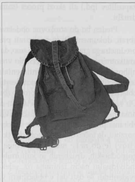
Vojaški nahrbtnik. Olivno zeleno bombažno platno, kovinske zaponke (na eni naramnici manjka) in členi za pretikanje vrvice, bela bombažna vrstica za zadrugovanje. Serijski izdelek za potrebe vojske. Dolžina 46 cm, širina 40 cm.

jo je nosila pozimi. Prav tako "nedopolnjen" je olivno zelen vojaški platneni nahrbtnik, ki ga je – pa čeprav povsem praznega – redno nosila s seboj.