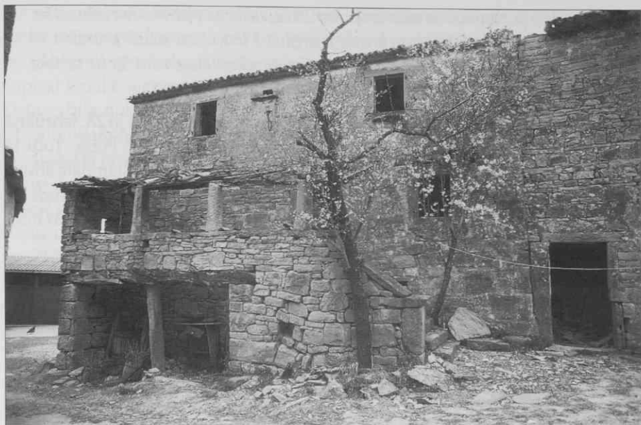
Razpadajoča hiša v Laboru (Marezige) z zunanjimi kamnitimi stopnicami (baladur). Foto R. Starec, 1995. ♦ Crumbling house at Labor (Marezige), with external stone stairs (baladur). Photo R. Starec, 1995. ♦ Une maison en ruine de Labor (Marezige) avec un escalier extérieur en pierre (baladur). Photo prise par R. Starec, 1995.

z apneno malto. Spodnja tla, grede in žebli so skupaj 140 lir, ognjišče je 10 lir. Na spodnjih tleh (v pritličju) sta dve zidni omari z obloženimi policami in vrati v vrednosti 10 lir. Tri obdelana kamnita okna s polkni in okovjem so vredna 42 lir. Ena vhodna vrata kleti in še ena obdelana vrata iz kamna, z dvema vratnima kriloma, okovjem in dvema ključavnicama - vrednost 66 lir. Zunanji kamniti podest (baladur) z dvema zaščitnima zidoma, desetimi stopnicami in kamnitim zaščitnim zidom ima vrednost 80 lir. Enajst gred zgornjega nadstropja brez desk ima vrednost 38 lir. Streha s strešniki, gredami, deskami, žebli, v velikosti 71 korakov, ima skupno vrednost 276 lir. Skupno 1315 lir in 10 soldov.