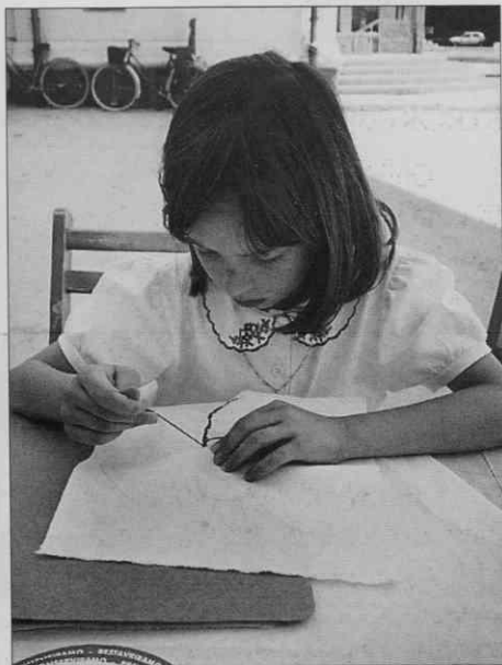
Naučila se bom vesti (foto: S. Kogej Rus, junij 1997).