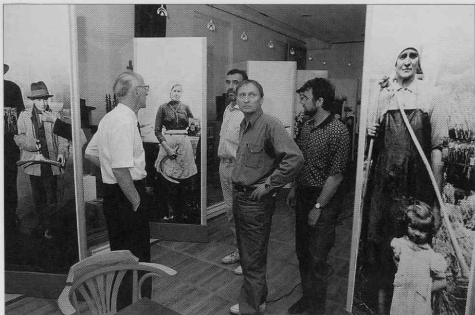
Nastajanje razstave Okna zbirke (foto: I. Omahen, junij 1997).

Pod poljudnimi naslovi so v besedi nanizane vse zbirke Slovenskega etnografskega muzeja. Predstavljene so z izbranimi eksponati in s strnjnim vedenjem o posameznih predmetih ali o razstavljenih skupinah reči. Razstava je poizkus opredmetenja tolikokrat ponovljenih besed o vsem, kar muzej hrani; o predmetnih pričah "gospodarjenja, dela, bivanja, oblačenja, trgovanja, družbovanja, ljubljenja, verovanja in umetniškega ustvarjanja..."