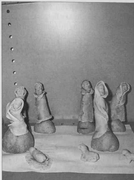
Figurice se morajo pred peko posušiti na zraku (foto: S. Kogej Rus).