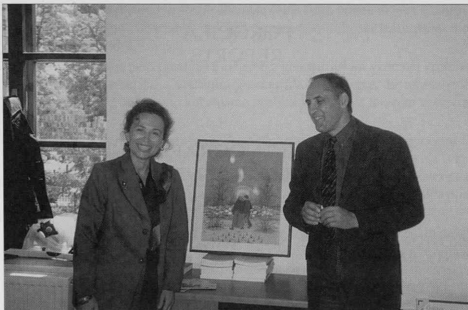
Darilo zagrebških kolegov ob selitvi v nove prostore (foto: I. Keršič, maj 1997).

upravni, informacijski, raziskovalni, avdiovizualni, založniški, konservatorsko-restavratorski in drugim dejavnostim (z javno čitalnico, predavalnico in manjšim razstaviščem). Izvajalec prenove, Gradbeno podjetje Grosuplje, je 13. februarja uspešno prestal tehnični pregled, 26. marca pa je bilo za stavbo pridobljeno uporabno dovoljenje.