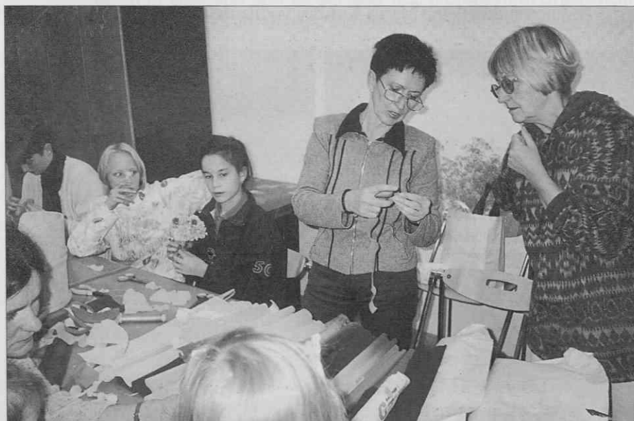
Izdelovanje cvetja iz papirja je pritegnilo tako mlade kot stare (foto: F. Požun, oktober 1997).