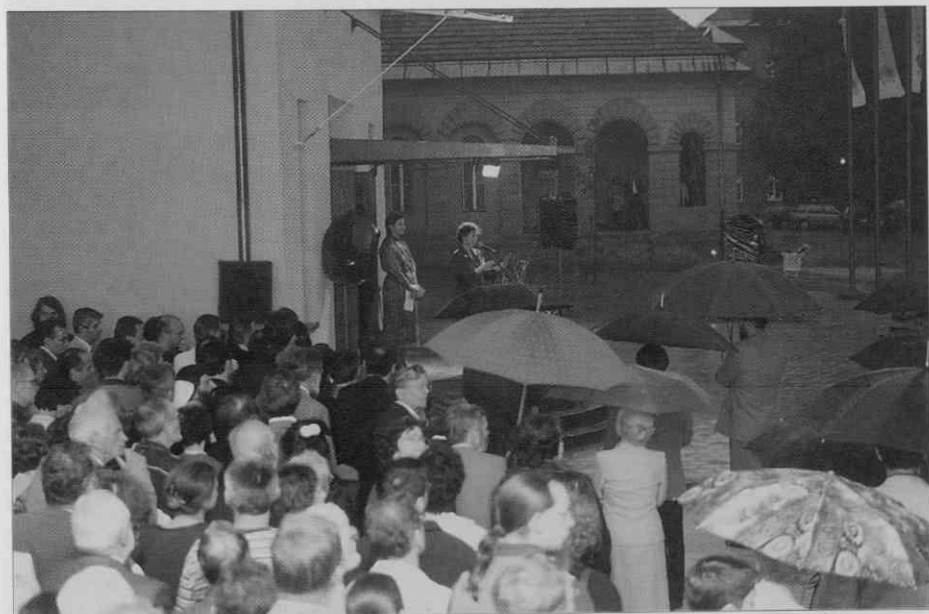
Vodni krst ni bil v programu odprtja (foto: I. Omahen, maj 1997).