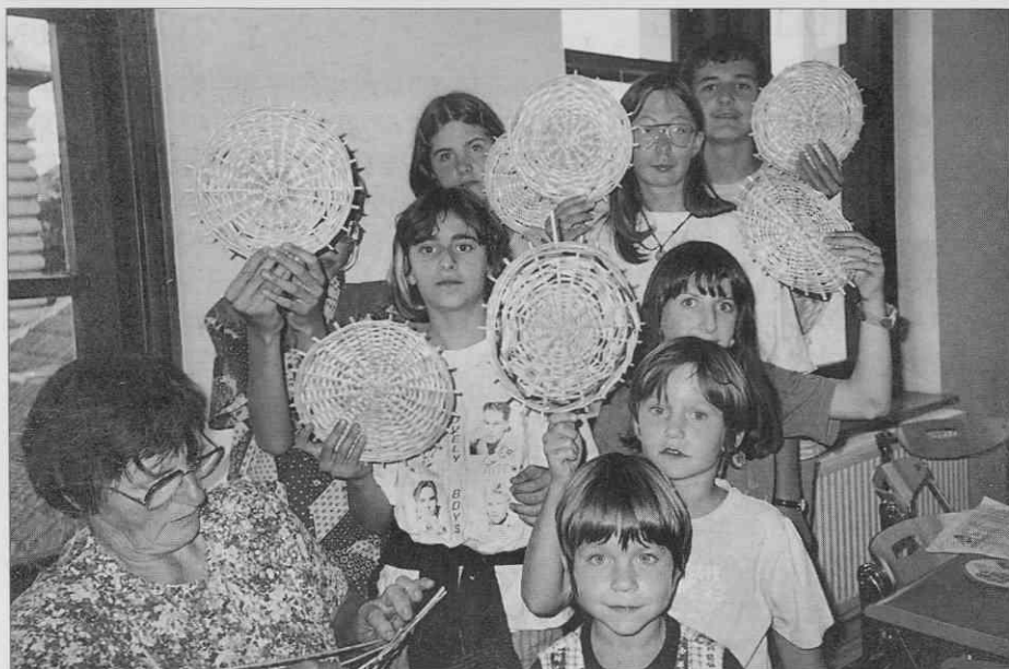
Ponosni udeleženci pletarske delavnice (foto: S. Kogej Rus, september 1997).