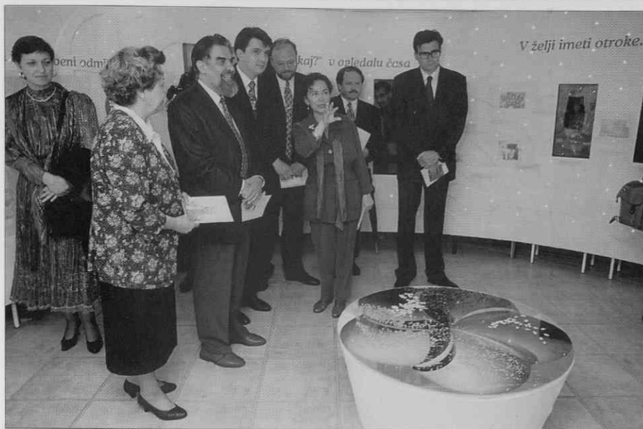
Vrata kroga (foto: I. Omahen, junij 1997).