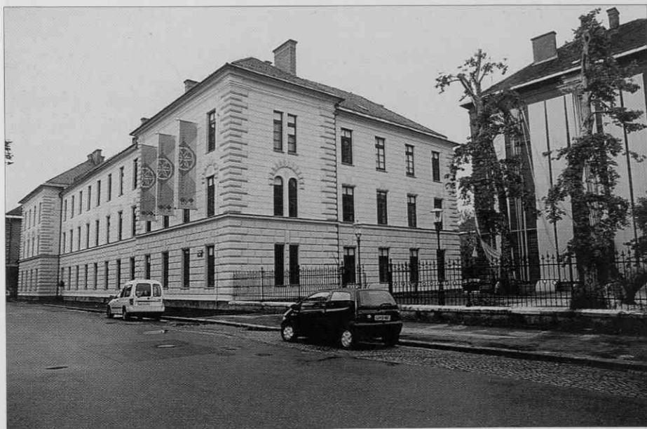
Novo domovanje Slovenskega etnografskega muzeja (foto: I. Omahen, junij 1997).

V prvih dneh junija je Slovenski etnografski muzej odprl vrata svojim obiskovalcem na novem naslovu, na Metelkovi 2. Preselil se je v prvo obnovljeno hišo na jugu stavbnega sestava nekdanje vojašnice, ki je bila zgrajena med leti 1886 in 1889 v nekdanjem ljubljanskem šempetrskem predmestju. Leta 1994 je bil ta južni del kompleksa s sklepom Vlade Republike Slovenije dodeljen Ministrstvu za kulturo. Slovenski etnografski muzej je spomladi leta 1995 dobil v njem v rabo dve stavbi. Najprej je bila omogočena notranja prenova manjšega, manj zahtevnega objekta; pogojno imenovanega upravna hiša, namenjenega