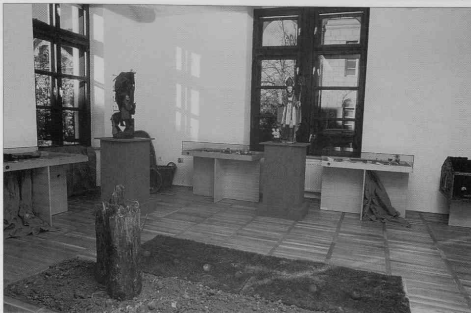
Jesen na razstavi V zavetju svetnikov.