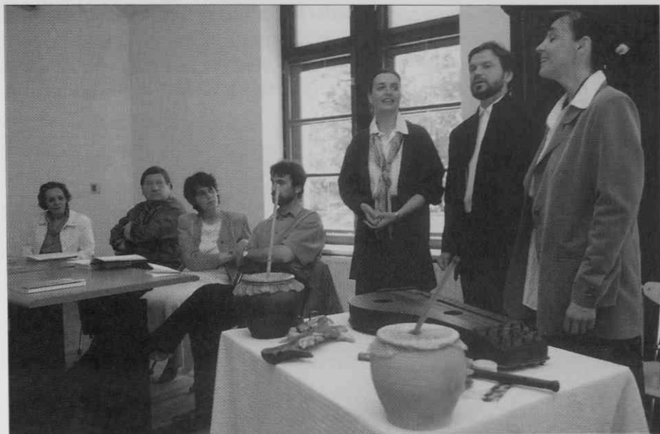
Preizkus akustike v novih prostorih - Trutamora Slovenica (foto: I. Omahen, maj 1997).