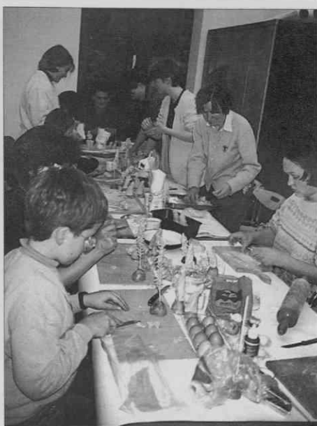
Delavnica izdelovanja jaslac iz testa (foto: I. Keršič, december 1997).

iz testa. V predbožičnem času so bili izdelki udeležencev razstavljeni na hodniku Slovenskega etnografskega muzeja.