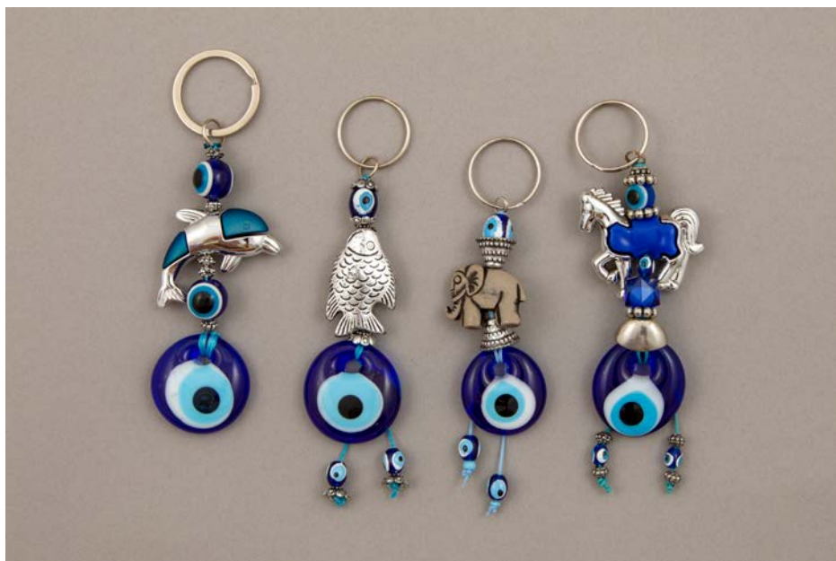
Stekleni amuleti z živalskimi simboli; zbirka SEM

sončno oko je bilo povezano s sončnim božanstvom Rajem, medtem ko je levo ali lunino oko pripadalo bogu v podobi sokola, Horu (Pinch 1994: 109–110). Kar nekaj egipčanskih mitov priča o magičnih močeh oči. Med najbolj znanimi je zgodba o dolgoletnem boju med bogom Horom in njegovim stricem Setom. Hor je želel maščevati smrt svojega očeta Ozirisa, hkrati pa se je proti stricu boril za moč na zemlji in vladavino nad Egiptom. V eni izmed njunih bitk je Set ranil Hora in mu poškodoval levo oko. Na pomoč sokoljemu božanstvu je prišel bog zdravilstva in magije Tot, ki je oskrbel njegovo oko in mu podaril magično moč. Hor je s pomočjo ozdravljenega očesa ponovno obudil in zlil v celoto telo svojega pokojnega očeta. Oziris je ponovno oživel in se odpravil v podzemlje, kjer je postal vladar onostranstva (Pinch 1994: 27).