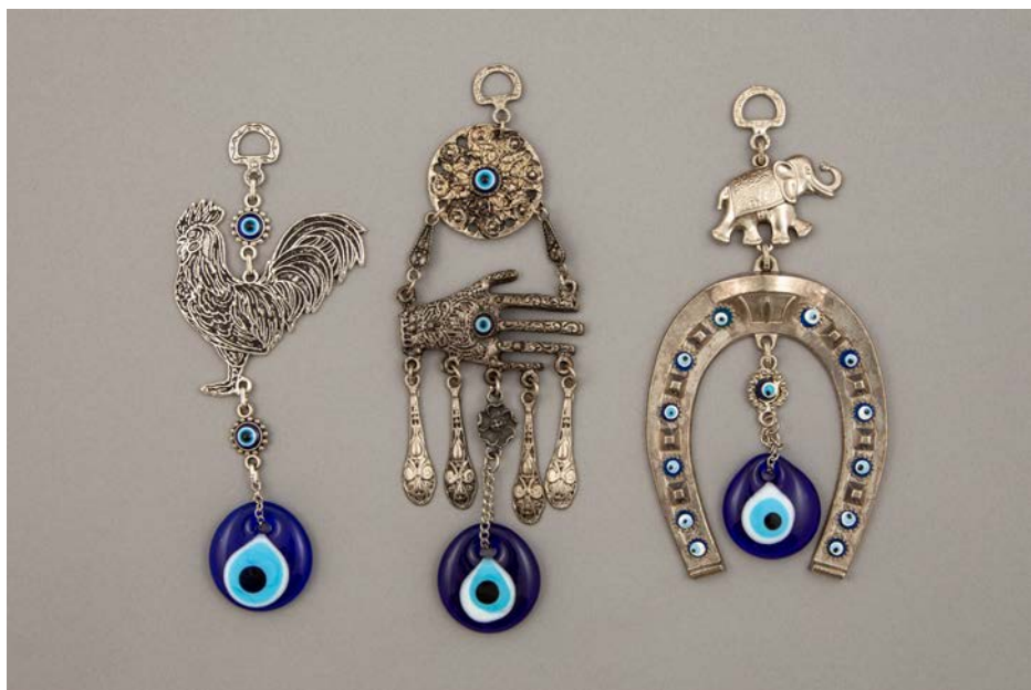
Med različnimi simboli je zelo zanimiva kombinacija slona in konjske podkve; zbirka SEM