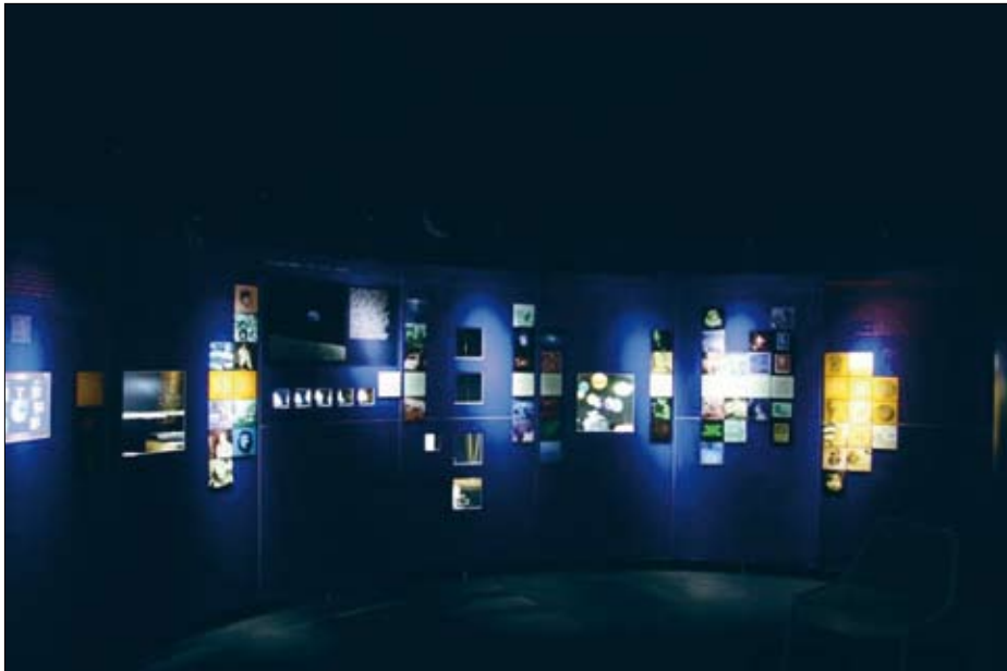
Razstavni sklop Moj osebni svet v okviru razstave Jaz, mi in drugi