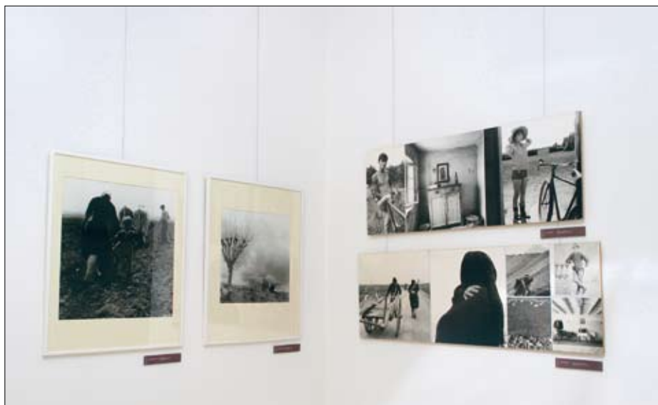
Fotografije na razstavi Pogledi/Sguardi