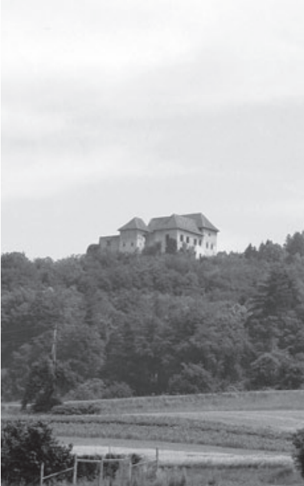
Grad Hmeljnik leta 2006.

bili prašiči, uvoženi s Hrvaškega. Zaradi prašičje kuge so na Dolenjskem leta 1906 za nekaj časa celo prepovedali trgovanje z njimi in ukinili prašičje sejme v Novem mestu. 31 Bolezen se je v nekaterih krajih Dolenjske ponovno pojavila leta 1909. 32 Oboleli prašiči so zaradi izgube apetita hujšali, veliko so pili, se opotekali, večino časa so preležali; imeli so težave z dihanjem, pogosto so kašljali; v blatu so bili sledovi krvi, po glavi, ušesih, vratu in trebuhu so se jim pogosto pojavile rdeče pegice ali mozolji. Nekateri so poginili v nekaj dneh, sicer pa je bolezen trajala od nekaj dni do nekaj mesecev. Če je prišla kuga v svinjak, je zbolelo do 95 odstotkov prašičev (Dular 1909: 146–148).