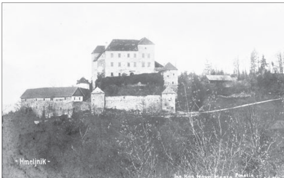
Grad Hmeljnik leta 1911

trgovanju z živino ... 18 Seveda pa je bilo potrebno za njegovo zdravljenje plačati, česar pa si revni dolenjski kmetje večinoma niso mogli privoščiti. Za tiste, ki niso bili iz bližnje okolice Novega mesta, je bil veterinar zaradi slabih prometnih povezav predaletč, zagotovo pa lahko med razloge uvrstimo tudi nezaupanje preprostih ljudi v postopke tedanje uradne veterine.