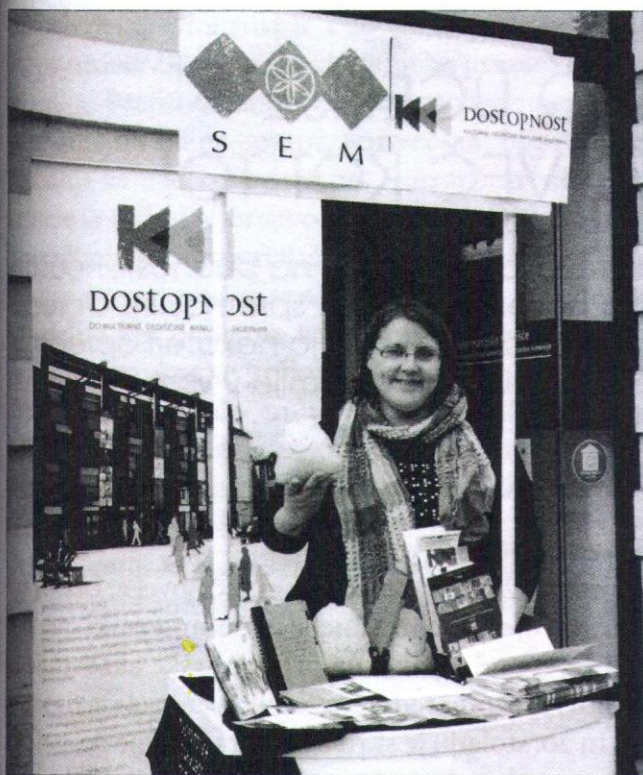
Stojnico projekta Dostopnost do kulturne dediščine ranljivim skupinam je bilo mogoče obiskati tudi ob Tednu Evrope pred Evropsko hišo na Bregu v Ljubljani maja 2014.