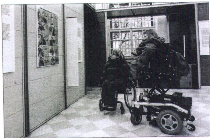
Muzeji vedno bolj postajajo prostori demokratičnega dialoga.