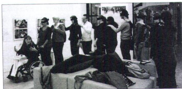
Zaposleni na projektu se nenehno izobražujejo z namenom, da bi se najbolje pripravili za delo s pripadniki ranljivih skupin.

Pri uresničevanju načel nediskriminacije in pri omogočanju dostopnosti kulturne dediščine vsem družbenim skupinam Slovenski etnografski muzej tehnično dopolnjuje prostore, saj se zaveda, da je