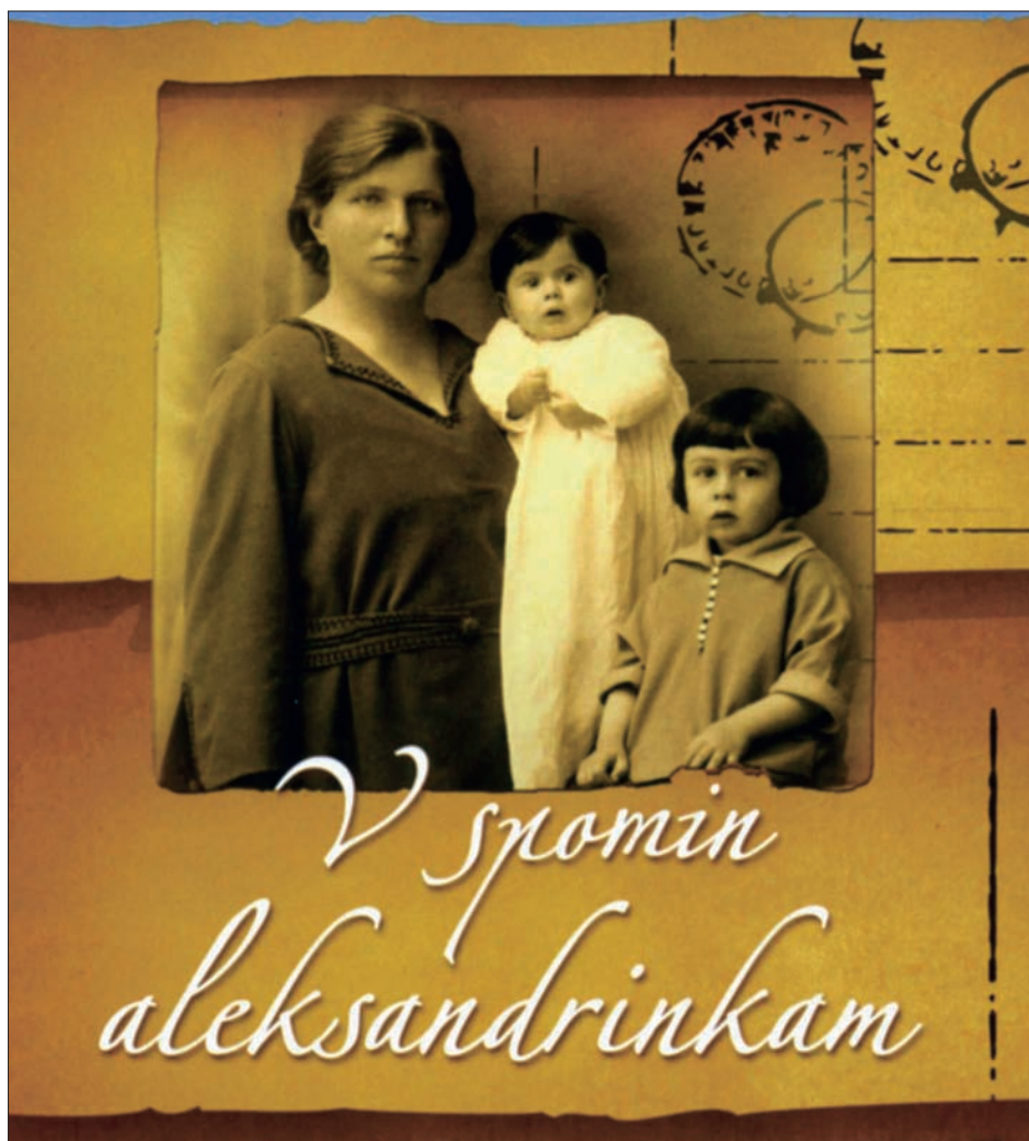
Naslovnica vabila na razstavo V spomin aleksandrinkam , ki je bila na ogled v knjižnici v Novi Gorici od 20. maja do 10. junija 2008, v organizaciji Društva za ohranjanje kulturne dediščine aleksandrinc Prvačina.

manj in predvsem šele, ko so njihovi otroci že dopolnili dve ali tri leta, tako da so se zaposlovale bolj kot varuške. 4 Deloma to lahko povežemo s koncem obdobja najhujše revščine, ki je Goriško zajela neposredno po prvi svetovni vojni, ko so ženske prijele za vsakršno delo in tako odšle tudi za dojljle v Egiptu. Četudi boleče, pa je bilo to delo v Egiptu najbolje plačano in za dojljle so v družinah delodajalcev tudi najbolje skrbeli. Zato tega dela tudi ni mogla dobiti vsaka. Proti koncu dvajsetih in v začetku tridesetih let 20. stoletja je najhujši ekonomski pritisk popustil, toda ženske so še vedno odhajale; a zdaj najpogosteje tiste, ki jim je na primer za posledicami prve svetovne vojne nekaj let po njej umrl mož (obolevali so za različnimi boleznimi, najpogostejša vzroka za smrt