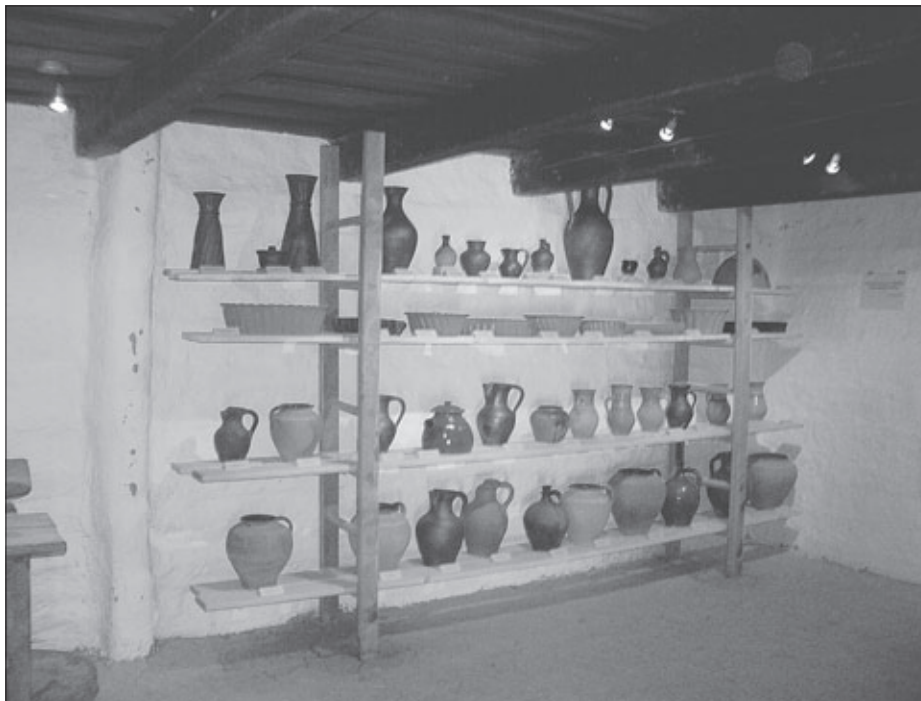
Razstavljeni lončeni izdelki v gospodarskem objektu Mlinarove domačije, 2006 (Fototeka Pokrajinskega muzeja Murska Sobota)