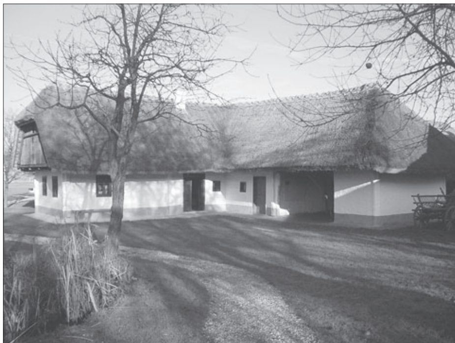
Mlinarova domačija, rekonstrukcija, 2006

Okoli leta 1950 so pri Mlinarovich prenehali izdelovati lončevino. Tako so lahko povečali kuhinjo z odstranitvijo stene proti delavnici, črno kuhinjo pa so predelali v sodobnejšo obliko. Med obe okni so postavili štedilnik, ob steni pri vratih pa zgradili preprosto krušno peč, t. i. bika . Sezidali so nov dimnik, do takrat pa je dim iz kuhinje uhajal skozi odprtino v stropu in najverjetneje skozi lesen dimnik na prosto. Istočasno so odstranili tudi prvotno krušno peč v velki izi .