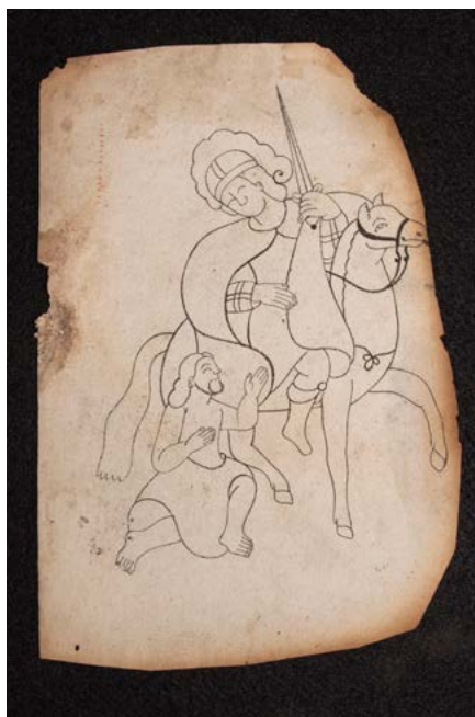
Sv. Martin. Predloga za slikanje slike na steklo, 19. stoletje, karton, kreda, v – 23 cm, š - 18. cm.

V največjem številu so te barvite slike prihajale na slovensko etnično ozemlje iz podeželskih slikarskih delavnic na Bavarskem, iz kraja Pohorji v Češkem lesu ter iz Sandla v Zgornji Avstriji. Prinašali so jih krošnjarji, kmetstvo pa jih je kupovalo na romanjih in žeganjih. Ob importu in pod njegovim vplivom so slike na steklo slikali tudi na Slovenskem. Po analogiji in glede na slogovni izraz na poslikanih panjskih končnicah je bilo približno 12 odstotkov evidentiranih slik na steklo pripisanih Selški delavnici iz Selc v Selški dolini ter slikarjema Mojstru okorne risbe in Mojstru malih figur. V zbirki SEM hranimo 62 slik iz delavnice v Selcah, 17 slik Mojstra malih figur in 13 slik Mojstra okorne risbe. V literaturi se omenjajo še tribuško čepovanske glažute in izdelovalci na Kočevskem, vendar njihovi izdelki niso bili identificirani.