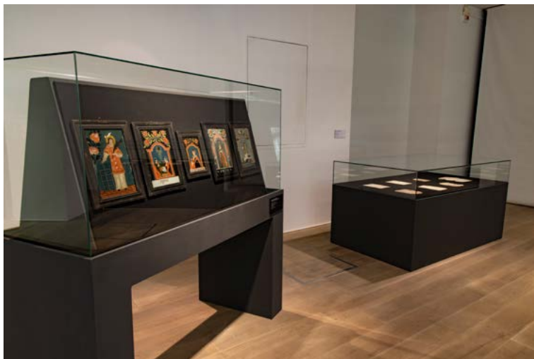
Vitrina s slikami na steklo Mojstra malih figur in vitrina s predlogami za slikanje slik na steklo.

Generalna skupščina Združenih narodov je na pobudo Mednarodne komisije za steklo (ICG), ICOM-Glass in Community of Glass Associations (CGA) leto 2022 razglasila za Mednarodno leto stekla 1 . Med več kot 1100 podporniki pobude iz 74 držav je bila tudi Slovenija, ki se ji je pridružila s projektom Po stekleni poti 2 , v okviru katerega so slovenski muzeji pripravili razstave izbranih steklenih predmetov iz svojih zbirk.