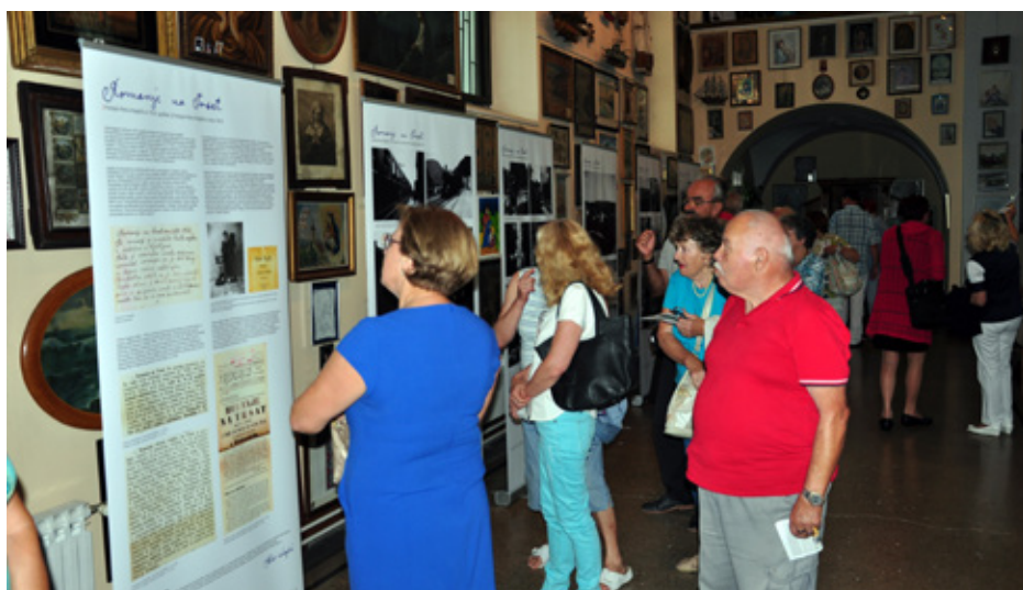
Pogled na panoje v kapeli votivnih darov na Trsatu