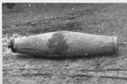
Sl. 11. Star trebušast valj (Duplje)