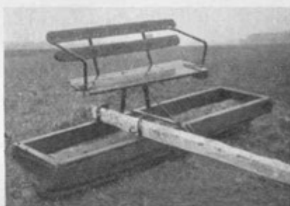
Sl. 12. Novejši valj s sedežem (Cerklje)