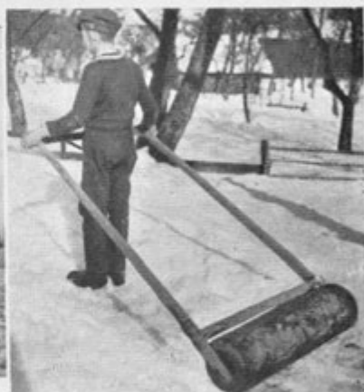
Sl. 10. Lahek ročni valj (Selca)