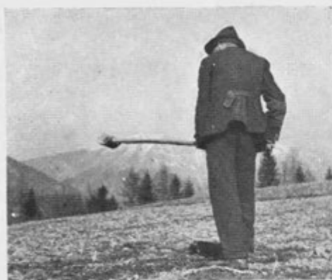
Sl. 9. Kij za razbijanje kep (Sv. Križ nad Jesenicami)