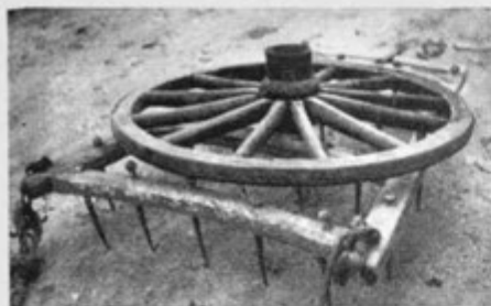
Sl. 7. S kolesom obtežena brana (Trzin)