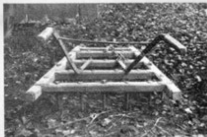
Sl. 8. Brana z ročicami (Podgorje)