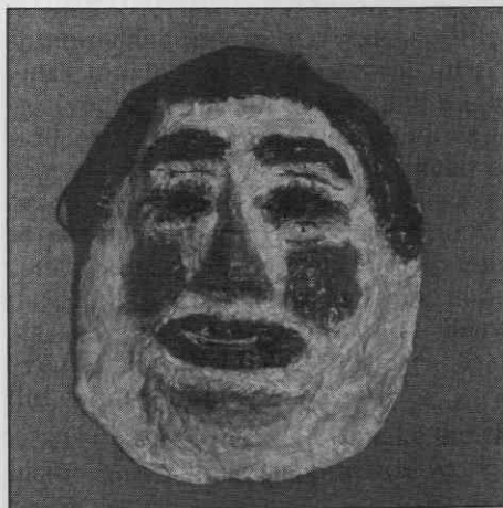
"Obraz Fašenka" iz Števanovec. Papirna kaša. Višina 21,5 cm, širina 16,8 cm, globina 4,5 cm. Muzej Avgusta Pavla, Monošter, Madžarska, inv.št. PAM 92.1.1 (foto A. Székely, 1992).

"Ta stari" ima na naličju "bajüjsi pa sakálo" (brke in brado) iz prediva. Drugi pastir ima brke in brado pobarvano.