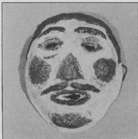
"Obraz" pastirja iz Števanovec. Papir. Višina 28,1 cm, širina 23,6 cm, globina 10,5 cm. Muzej Avgusta Pavla, Monošter, Madžarska, inv.št. PAM 92.1.4.