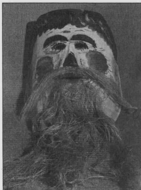
"Obraz Fašenka" iz Števanovec. Papirna kaša. Višina 21,8 cm, širina 17,9 cm, globina 8,3 cm. Muzej Avgusta Pavla, Monošter, Madžarska, inv.št. PAM 92.1.3.