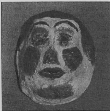
"Obraz Lenke" iz Števanovec. Papirna kaša. Višina 20,5 cm, širina 17,8 cm, globina 7,5 cm. Muzej Avgusta Pavla, Monošter, Madžarska, inv.št. PAM 92.1.2.