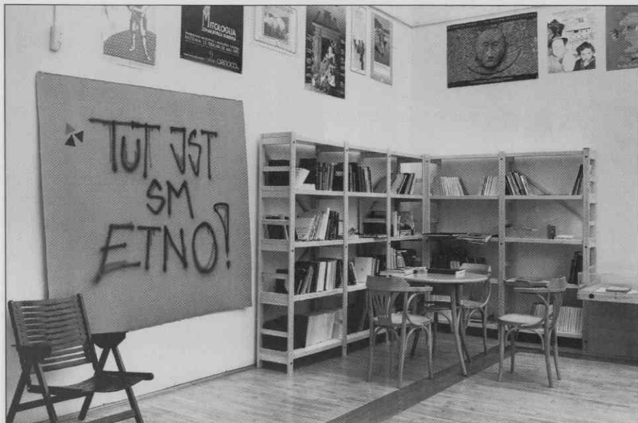
Del razstave Po sledih vsakdana je bila razstava etnoloških publikacij.

pozabljene dejavnosti - kamnoseštvo ter kamen v oblikah, ki kažejo na način življenja v slovenskem primorskem svetu.