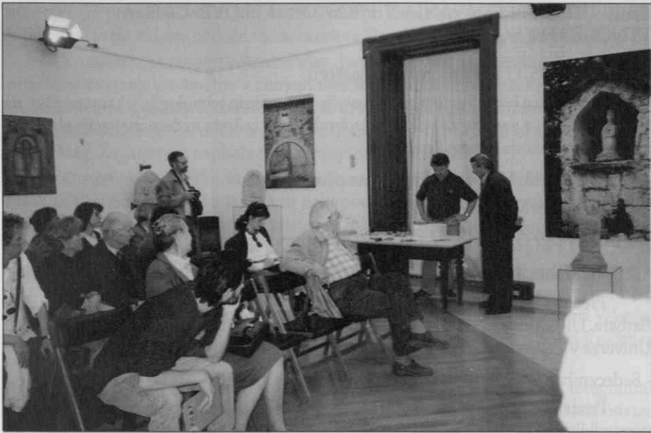
Predavanje z demonstracijo obdelave kamna je bilo 23. maja 1995 sredi razstave Kamniti svet.