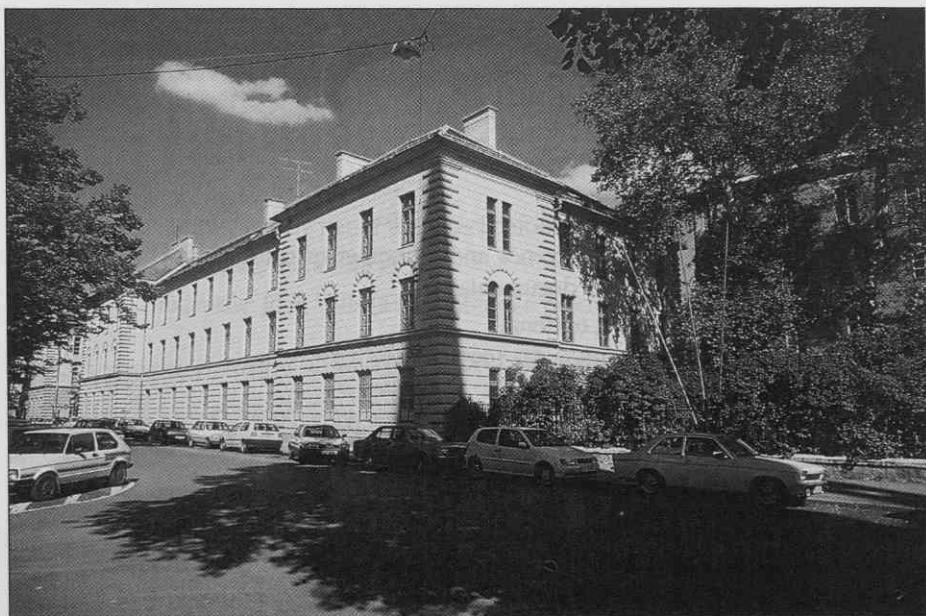
Objekt št. 28 na Metelkovi je namenjen naslednjemu: upravi, raziskovalni, založniški, konservatorsko - restavratorski dejavnosti in za javnost odprtim knjižnici, dokumentaciji in predavalnici oziroma prostoru za manjše prireditve.

Leto 1995 je za Slovenski etnografski muzej zaznamovano z bistvenim premikom, s stvarnimi dogodki v procesu reševanja dolgoletne prostorske stiske. Julija 1994 je Vlada Republike Slovenije sklenila, da Slovenski etnografski muzej dobi svoje prostore v južnem delu kompleksa nekdanje vojašnice na Metelkovi, ki ga je dodelila Ministrstvu za kulturo. In slednje, ki se je odločilo za podvig, imenovan "streho nacionalkam", je 29. marca 1995 Slovenskemu etnografskemu muzeju s pogodbo oddalo dva izmed šestih objektov (s površinama 3500 in 1900 m 2 ) za razstavno in skoraj vso drugo muzejsko dejavnost in nekaj kasneje na isti lokaciji zagotovilo še prostor (s površino 2000 m 2 ) za muzejsko depo. Bilo je spoznano in odločeno, naj se vprašanje Slovenskega etnografskega muzeja na Metelkovi rešuje v celoti; poleg njega bosta tam dobili manjkajoči prostor še dve nacionalni muzejski hiši, Narodni muzej in Moderna galerija.