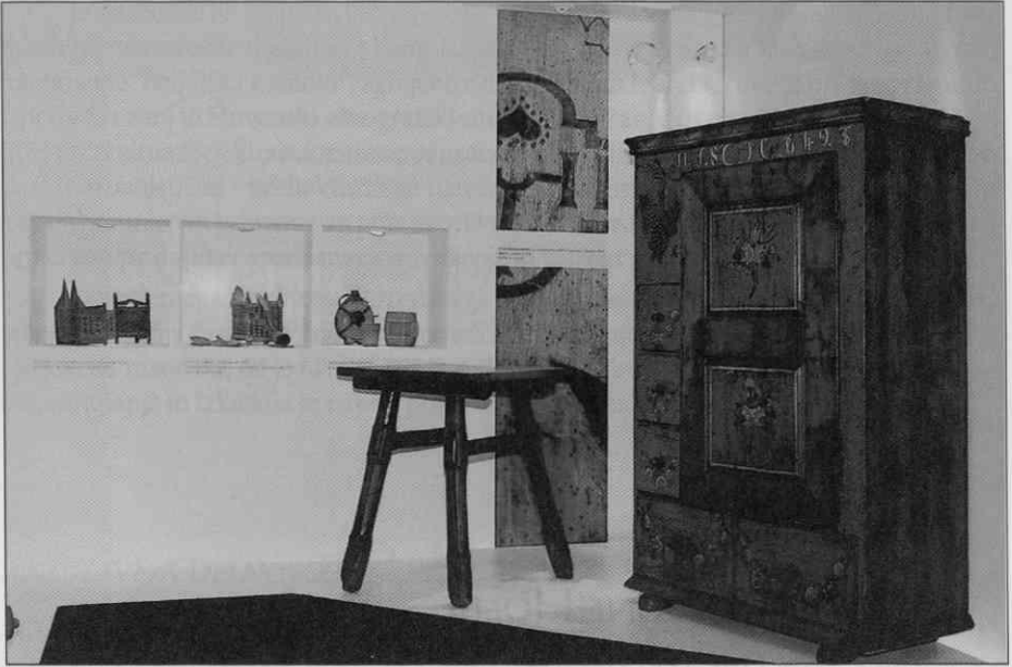
Z razstave V sožitju z lesom, predstavitve Belinke in Slovenskega etnografskega muzeja na sejmu Alpe Adria. (1995)