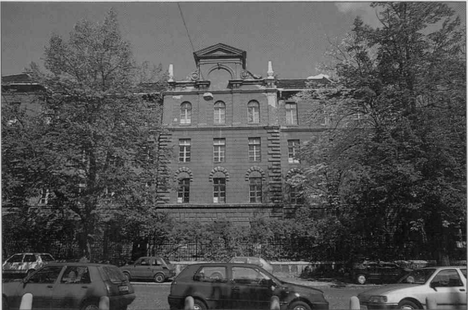
Objekt št. 27 na Metelkovi je potreben zahtevnejših sanacijskih posegov in bo v celoti namenjen javnostim: razstavam, ustvarjalnim delavnicam, prostorom za pedagoške aktivnosti in za prireditve, okrepčevalnici, muzejski trgovini...