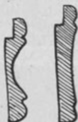
OBIČAJNI PROFIL OKVIRJA MOJSTRA MALIH FIGUR