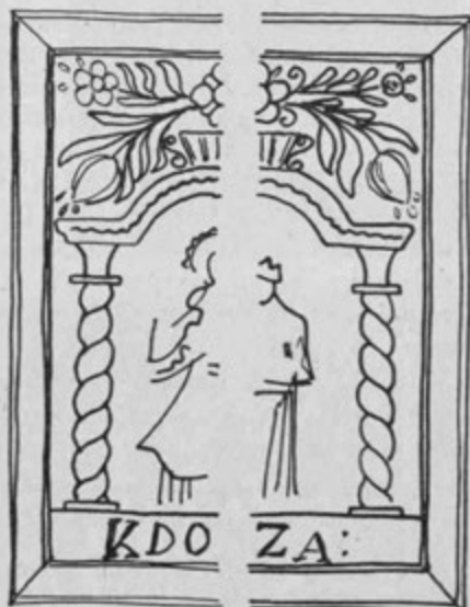
KARTUŠI DELAVNICE IZ SELC