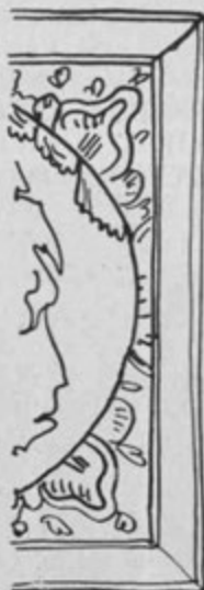
KARTUŠA MOJSTRA OKORNE RISBE