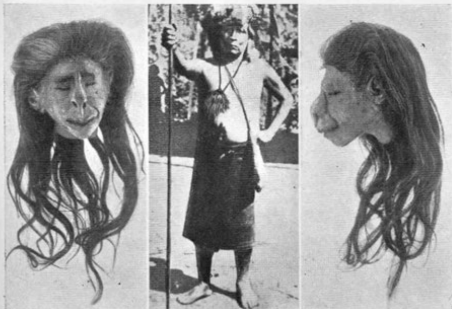
Sl. 3. Čanca iz Etnografskega muzeja v Ljubljani