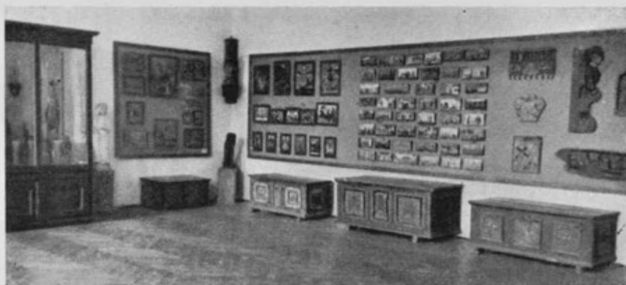
Pogled v dvorano ljudske umetnosti in običajev.