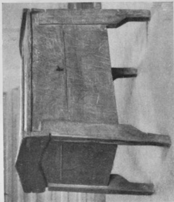
Iz preurejenega Etnografskega muzeja v Ljubljani

Levo: Pogled v dvorano materialne kulture.