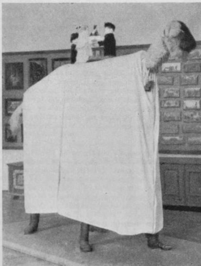
»Gambóla«, pustna žival s Ptuijskega polja.