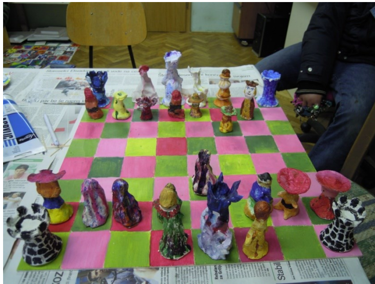
Šah za inteligentne – Kralji ulice

Zelo sem vesela, da so del mojega ustvarjanja tudi delavnice, ki mi omogočajo mnogo povezav z ljudmi, ki jih veselijo iste stvari. Zelo rada spoznavam različne ljudi, zanimive posameznike, ki me učijo spoznavanja različnosti, tolerance in sprejemanja sočloveka. Ob ustvarjanju nekako izginejo razlike med nami in vsi dobimo veliko pozitivne energije. Zelo sem vesela in hvaležna, da imam priložnost voditi delavnice z različnimi skupinami ljudi, s katerimi se vedno naučimo česa novega in preživljamo skupaj kvalitetno izkoriščen čas. Najrajši imamo skupinske izdelke, kjer vsak naredi svoj del, tako je celota mozaik naših stilov. Tako sta na primer nastala gledališka kulisa in šah na delavnicah s Kralji ulice, ter poslikava sten v Mladinskem centru Litija.