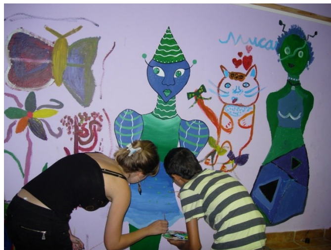
Poslikava sten – Mladinski center Litija