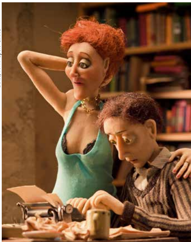
Boles, Arhiv Špele Čadež