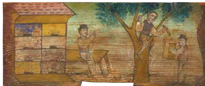
Poslikana panjska končnica; Čebelarški muzej v Radovljici

In če morda še niste vedeli za mednarodno uspešnost našega medu – slovenski med je 19. slovenski proizvod, registriran pri Evropski komisiji.