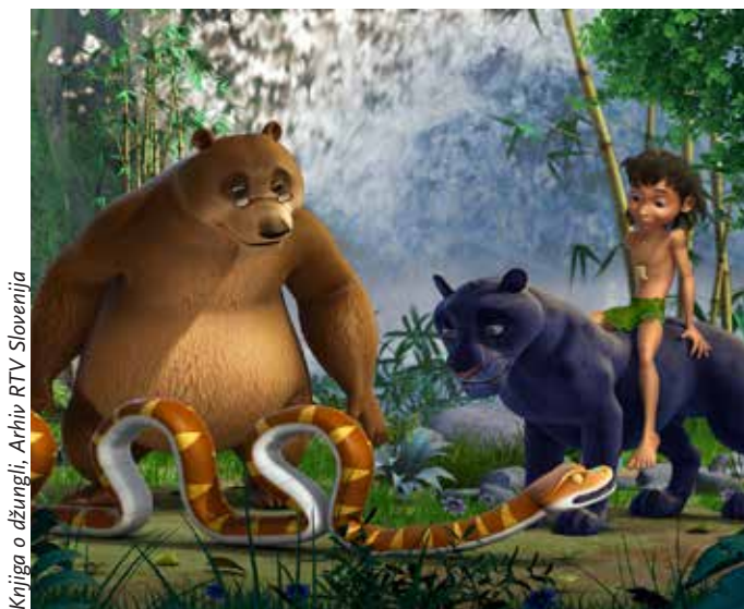
Knjiga o džungli

Medijsko opismenjevanje otrok se začne že v zgodnjem otroštvu in žanr, ki je otrokom najbližji, so zagotovo risanke. Toda – ali so res vse risanke primerne za otroke? Na kaj moramo biti še posebej pozorni, ko se odločamo, katere risanke otroku ponuditi v njegovih prvih srečanjih z mediji? In kakšen pomen ima za otrokov razvoj kakovostna sinhronizacija v slovenski jezik? Na predavanju boste dobili odgovore na ta in še veliko drugih pomembnih vprašanj, povezanih z risankami za otroke.