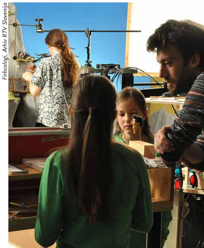
Firbcologi, Arhiv RTV Slovenija

Rezultat te povezave umetniškega in znanstvenega so realizacije osmih umetniških interaktivnih robotskih del študentov ALUO in FE.