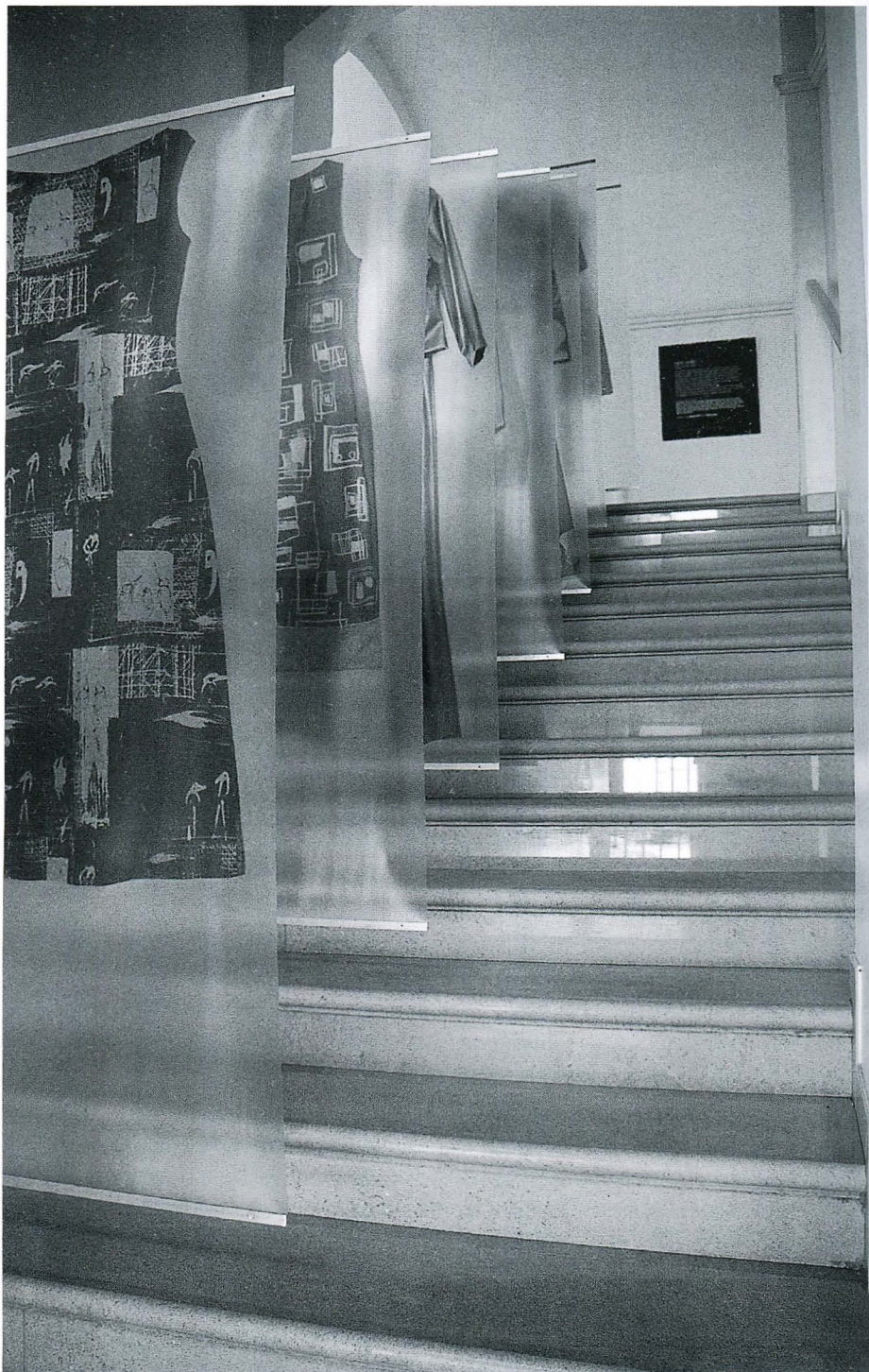
Z razstave Čutim modro