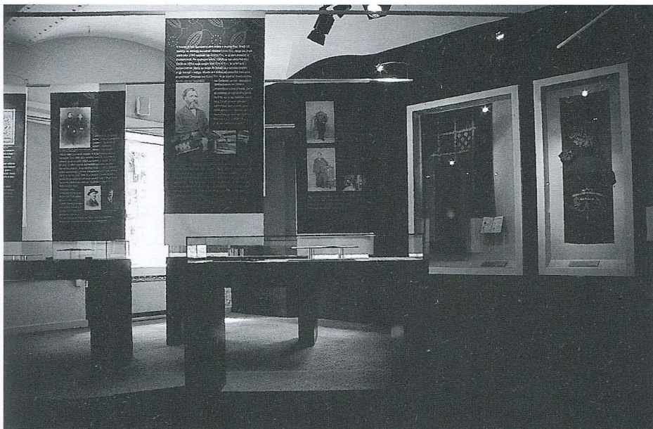
Pogled v razstavni prostor

tiskanja kot na slednji kriterij tipologije ločuje avtor med modeli za sosedno oziroma raportno tiskanje (motiv se nadaljuje, je »neskončen«) in t.i. pečatnimi modeli z oblikovno zaključenimi motivi.