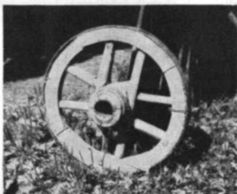
Zgoraj: ralice iz Bele Krajine, v sredini: voz iz okolice Turjaka, spodaj levo: voz za gnojavožo iz Zg. Tuhinja, spodaj desno: križevato kolo iz Vrhnike pri Ložu