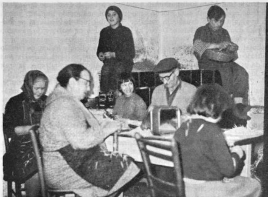
Večer pri kmetu Baldku v Malih Lipljenih. Domači in sosedje izdelujejo skupaj zobotrebce. (Fot. pozimi 1965)

(za olje in pozneje za petrolej). Važnejše kot to pa je bila potreba po družabnem življenju. To je bilo že od nekdaj v teh krajih močno razvito. Razvite so bile najrazličnejše oblike medsebojnih odnosov. Močno je bila razvita tudi fantovščina. Tu je bila že poprej navada, da so se vaščani redno, ob zimskih večerih zbirali na preji. O tem zgovorno pripoveduje zapis: