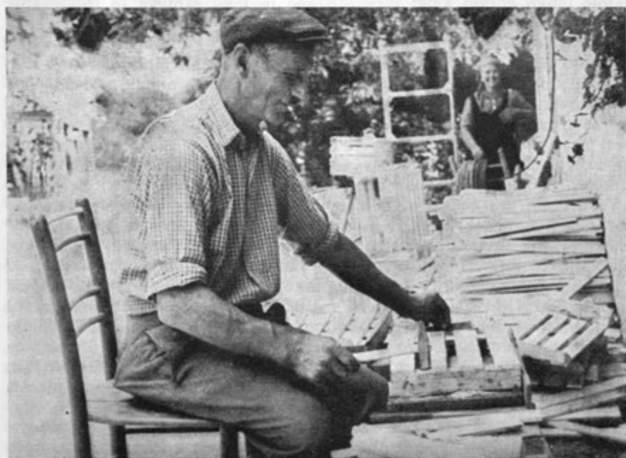
Kmet Sever iz Malih Lipljen zbija gajbe

Spremembe v domači obrti Škocjanskih hribov kažejo, da so bili tudi ljudje pri obdelovanju lesa vedno spretni in domiselni in da so tudi svojo hišno dejavnost in domače obrti prilagajali življenjskim potrebam, dejanskemu stanju, zahtevam na trgu, in v zadnjih letih jih prilagajajo tudi vsem spremembam, ki jih prinaša današnji čas. Tako je domačo obrt izdelovanja zobotrebcev in gajbic pri posameznih kmetih nadomestilo celo izdelovanje lesenih gradbenih elementov za weekend hiše. S tem pa se