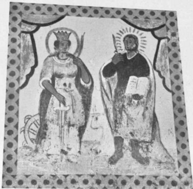
So. Katerina in sv. Luka. Slikarija na hišni fasadi (Logarska dolina št. 20)