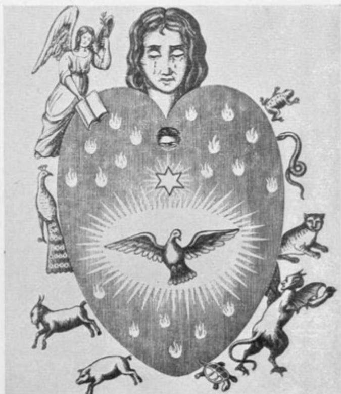
Ilustracija iz knjige »Serze ali Sposnanje in sbojšhanje zhloveshkiga serza. V Ljubljani, 1851. Natisnjeno per Rosalii Eger«