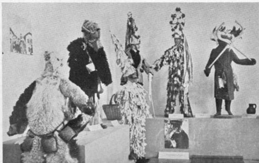
Z razstave slovenskih ljudskih mask v Slovenskem etnografskem muzeju od aprila do decembra 1963

Zgoraj: dobropoljska mačkara (Dolenjska) — Ta bršljanast, Cerkno (Primorska); spodaj: Soura (Tolmin), Pust (Drežnica), Ta cunjast (Kubed), trije Skoromati (Brkini)