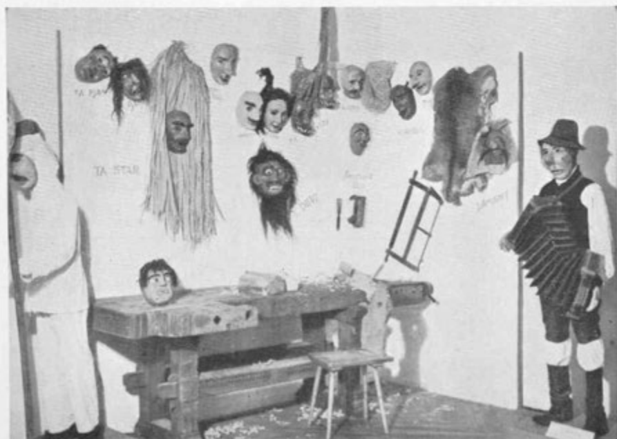
Z razstave slovenskih ljudskih mask

Zgoraj: Borov oče (Prekmurje) — Pust iz Drežnice (Primorska); spodaj: maske cerkljanskih laufarjev (Primorska)