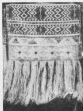
Sl. 1 (inv. št. E 85) Brisača Cankova , 80 let, dolžina 146 cm, širina 55 cm, ornament, lan, rese, stanje dobro. — Sl. 2 (inv. št. E 79) Brisača, Suhi orh pri Fokovcih , 60 let, dolžina 67 cm, širina 55 cm, ornament, lan, rese, stanje dobro. — Sl. 3 (inv. št. E 52) Brisača »Törölköző« , Motvarjevci, 70 let, dolžina 145 cm, širina 58 cm, ornament, bombaž, rese, stanje dobro. — Sl. 4 (inv. št. 59) Törölköző , Domanjševci, 80 let, dolžina 146 cm, širina 58 cm, ornament, lan, rese, stanje dobro. — Sl. 5 (inv. št. E 18) Domanjševci , 50 let, dolžina 98, širina 56 cm, ornament, lan, rese, stanje dobro. — Sl. 6 (inv. št. E 63) törölköző , Dobrovnik, 80 let, dolžina 204 cm, širina 29 cm, ornament, lan, rese, stanje dobro