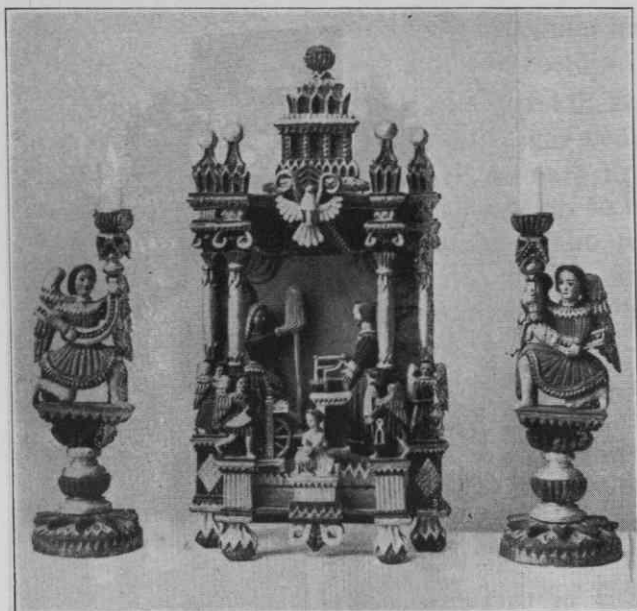
Dva keruba in Sv. Družina.