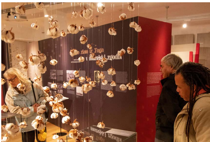
Obiskovalci na odprtju razstave Belo zlato: Zgodba o bombažu