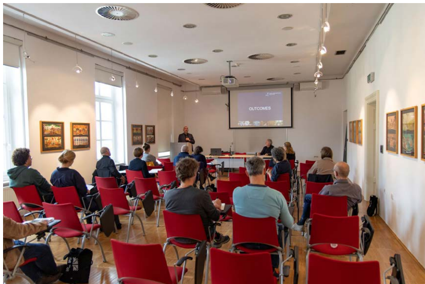
Mednarodno srečanje Od ohranjanja do skrbi v Ljubljani

Raziskovalni inštitut Konzervatorskega centra na Inštitutu za varovanje kulturne dediščine, ki je v ta namen pripravil analizo izbranih predmetov iz SEM.