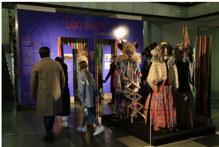
Razstava Liški pust je bila na ogled v pustnem času (foto: Miha Špiček, 2022)