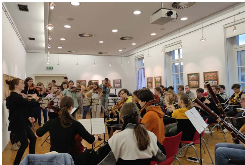
Mladi ukrajinski glasbeniki na vaji v SEM