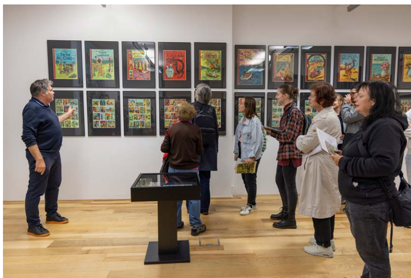
Vodeni ogled po razstavi ATAK z avtorjem razstave (foto: Blaž Verbič, 2022)

ljubitelji, in arhivsko gradivo, ki je z neobremenjenimi interpretacijami oživilo prigode dveh stripovskih junakov, detektivov. Slednja sta tako zaživela povsem svoje življenje zunaj izvornega konteksta. Razstavni projekt je izpostavljala vprašanje, kaj je umetnost in kakšna sta njena vrednost in pomen za najširšo publiko. S samosvojimi reinterpretacijami oziroma Atakovo apropiacijo stripovskih legend je razstava ponudila novo branje klasikov in omogočila sveže podoživljanje dogodivščin znamenitih junakov. Projekt, ki mu je avtor posvetil več kot desetletje svojega ustvarjanja in ki ga z novimi kosi še vedno po malem dopolnjuje, je posredno obravnaval tudi fenomen zbirateljstva in vprašanje identifikacije s fenomenom popularne kulture.