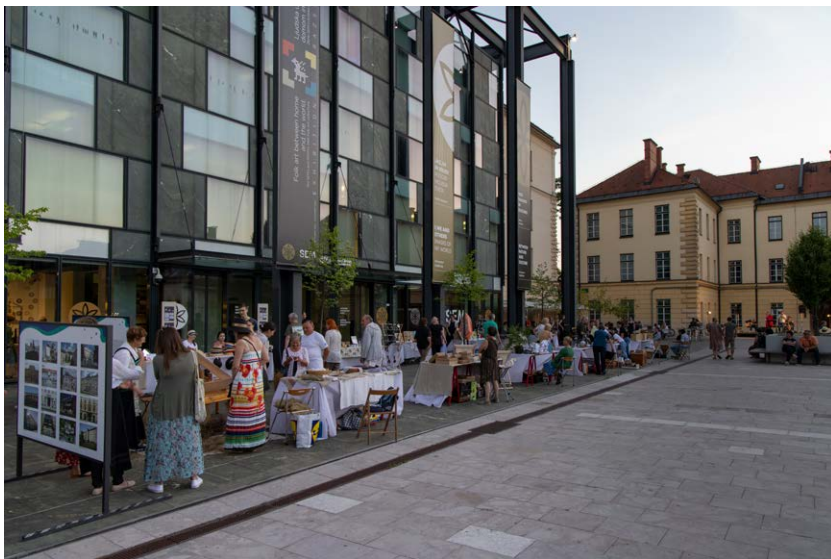
SEMenj - rokodelci na Poletni muzejski noči