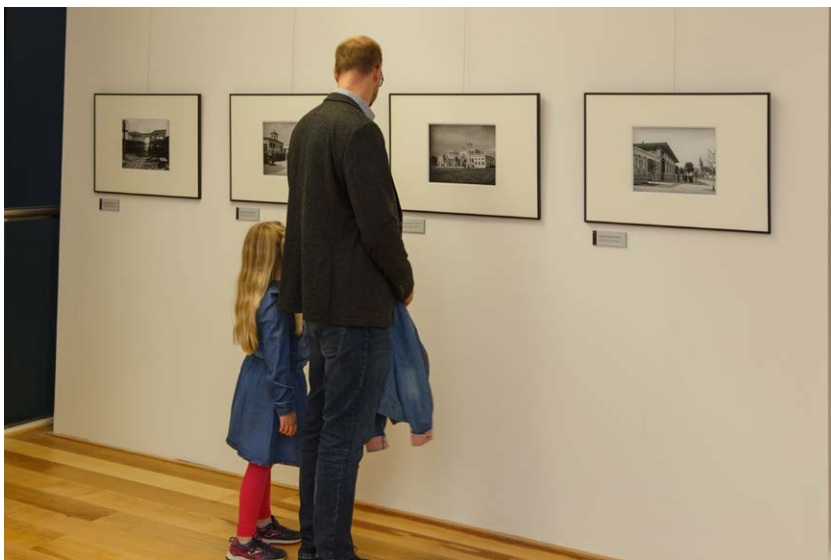
Utrinek z odprtja fotografske razstave Zlata doba Plečnikove arhitekture

pridobiti novo publiko. Od manjših gostujočih razstav iz Slovenije je SEM gostil razstavi, ki ste se tematsko navezovali na iztekajočo razstavo SEM Mi za mizo ; to sta bili Ob mizi z Ivanom Ivačičem (gostovanje iz Posavskega muzeja Brežice) in razstava plakatov Naravoslovnotehniške fakultete iz Ljubljane, naslovljena NTF za mizo . Razen tega je SEM pripravil dve zunanji razstavi; prvo, Potujoči VAZ , v sklopu projekta VAZ (Vzhodnoazijske zbirke v Sloveniji) s fotografijami azijskih zbirk iz Slovenije, in drugo, ki jo že tradicionalno priredi ob mednarodnem muzejskem dnevu v sodelovanju s slovenskimi državnimi muzeji, tokrat z naslovom Skrita moč muzejev .