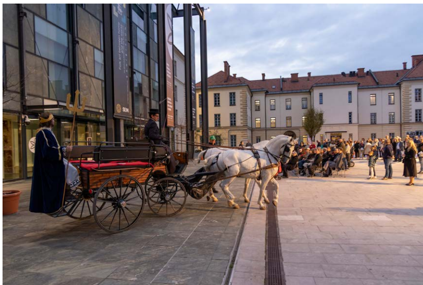
Prihod Pozejdona na kočiji z lipicanci na odprtju razstave Sveti konji - nebesni jezdeci

je bil še posebej zanimiv prikaz izjemnih primerkov keramičnih kipcev konjev z jezdeci, ki so jih za obredne namene uporabljali pred skoraj 2500 leti. Z izbranimi umetniškimi mojstrovčinami je bil predstavljen tudi simbolni pomen konjev in jezdecev v Afriki in Aziji. Razstavniki eksponati iz različnih slovenskih in tujih muzejev so prikazovali mojstrovine obrtnikov in umetnikov, ki so ustvarjalni navdih našli v vsebinah, povezanih s konji in jezdeci v resničnem in mitološkem svetu.