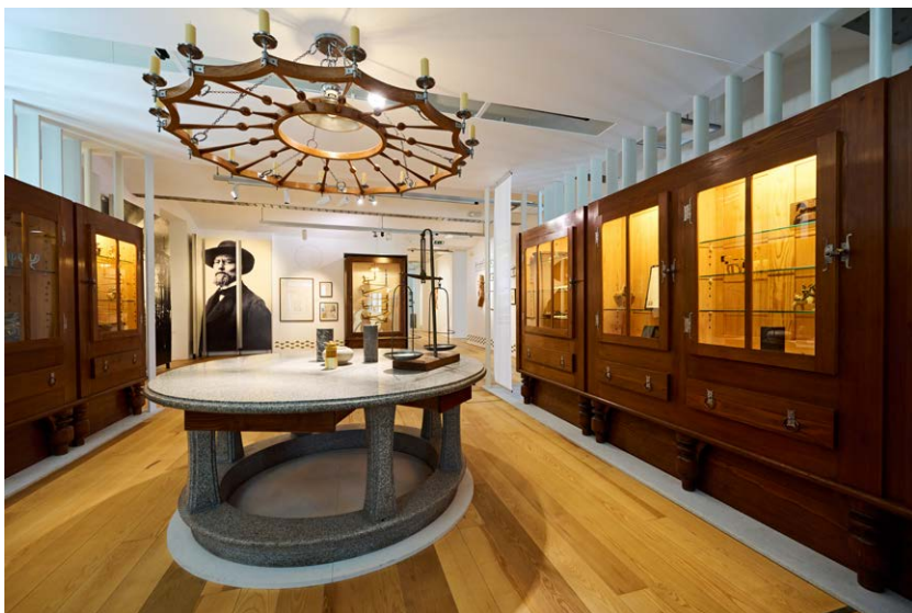
Stalna razstava Plečnikova Lectarija