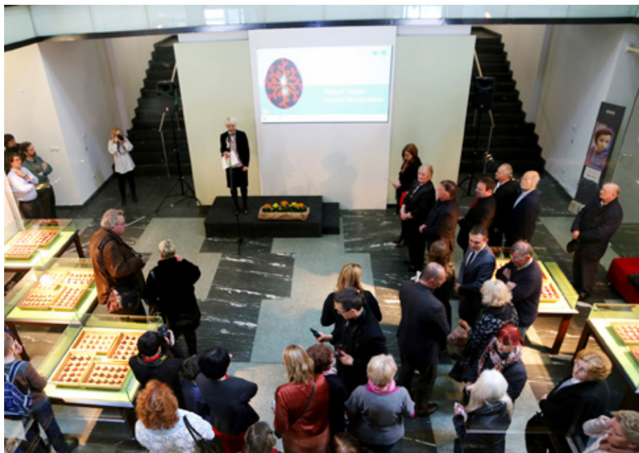
Odprtje razstave Madžarski pirhi iz Prekmurja

Nesnovna kulturna dediščina Srbije (razstavna hiša SEM, 16. maj–3. junij 2018)