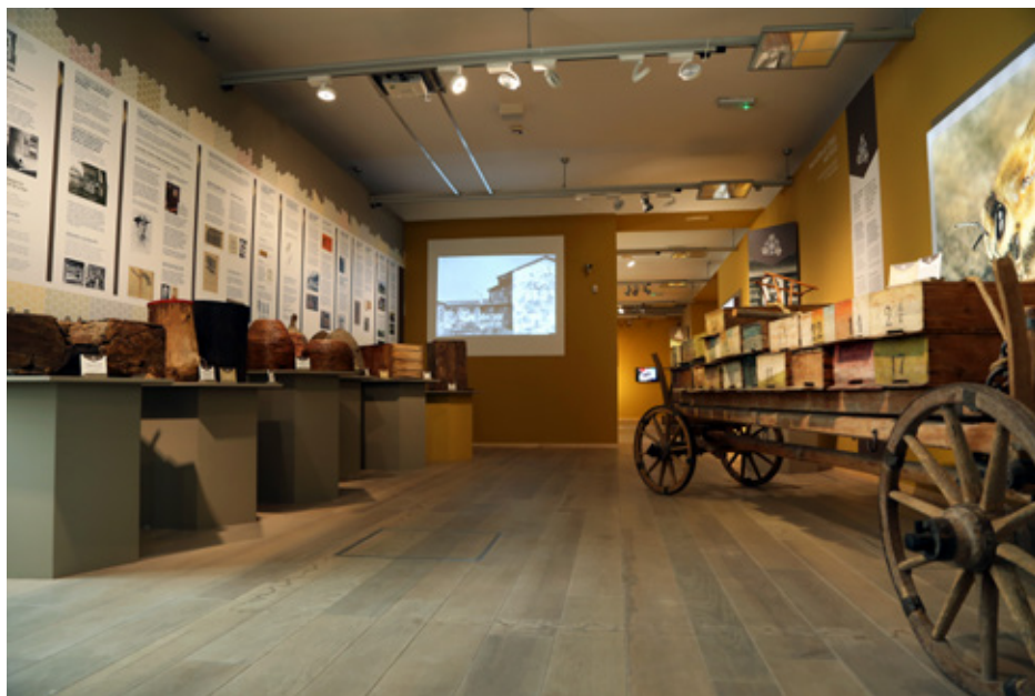
Osrednja razstava leta 2018 Kjer so čebele doma je predstavila bogato čebelarstvo dediščino, ki večplastno zaznamuje slovensko kulturno krajino

Razstava je razkrivala zbirke SEM in podala pogled na avtohtono kranjsko čebelo, panje, poslikane panjske končnice in čebelnjake, katerih bogata dediščina večplastno zaznamuje slovensko kulturno krajino. Slovenija, ki je domovina odličnih čebelarjev in avtohtone kranjske čebele, ima več kot 11.000 čebelarjev, slovensko pokrajino bogati več kot 13.000 čebelnjakov in okoli 180.000 panjev s čebelami, ki nabirajo kakovosten med in dajejo druge pridelke.