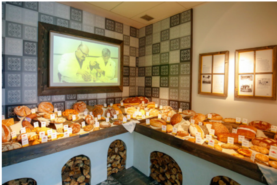
Po kruhu je v SEM zadišalo na priložnostni razstavi Kruh med preteklo in sodobno ustvarjalnostjo