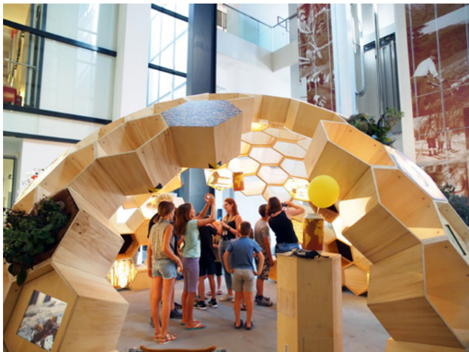
Paviljon Čebelji svet je bil del spremljevalnega programa ob razstavi Kjer so čebele doma in je s svojimi vsebinami pritegnil številne obiskovalce.