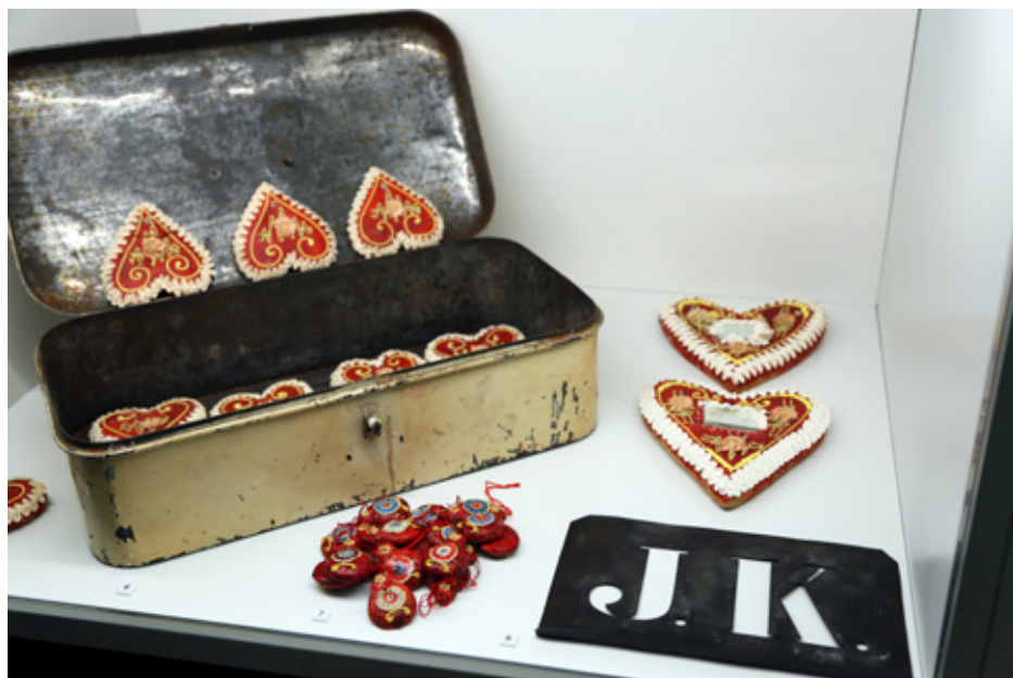
Razstava Lectarstvo je krajcarkšeft je nova stalna postavitev SEM