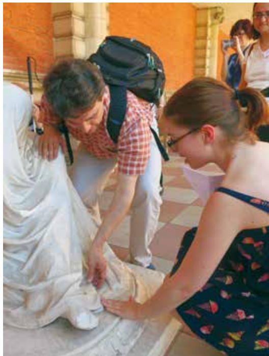
Sodelavka galerije Royal Holloway Picture Gallery v Londonu vodi slepega obiskovalca pri ogledu kipa Erinna.

Javnost sicer muzeje in galerije še vedno razume kot izobraževalne ustanove, pomembne za lokalno in nacionalno pripadnost, hkrati pa jih vse bolj doživlja kot prostore za sproščeno in kakovostno preživljanje prostega časa in priložnost za osebno rast (Rovšnik 2012: 80). Ljudje jih obiskujejo zato, da bi “investirali” vase – krepili svoj družbeni, kulturni in simbolni kapital – in se v določenih primerih spopadli z negativno izkušnjo izključevanja (gl. Newman in McLean 2004). Sodobni obiskovalci v muzejih tako najprej iščejo pozitivno socialno izkušnjo: želijo si biti sprejeti, navezati nove stike z ljudmi in pri tem zadovoljiti tudi svoje etične potrebe – empatijo, človekoljubje in sočutje (Šturm 2012: 77). Na pozitivno vrednotenje obiskovalčeve muzejske izkušnje najbolj vpliva prav zadovoljujoča interakcija med ljudmi; in tudi slepi in slabovidni so z obiskom muzeja zadovoljni takrat, ko se počutijo enakovredno vključene v skupnost polnočutnih oziroma ko jih obravnavajo kot njim enake (gl. Candlin 2003). To trditev potrjujejo tudi pripovedi slepih in slabovidnih o obiskih slovenskih muzejev: