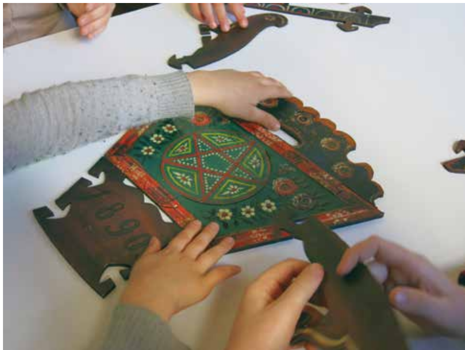
Slepi in slabovidni otroci pri igri s sestavljanke, narejeno za tipno ponazoritev zibke z razstave Med naravo in kulturo Slovenskega etnografskega muzeja, ob obisku sodelavcev projekta Dostopnost do kulturne dediščine ranljivim skupinam na Zavodu za slepo in slabovidno mladino v Ljubljani.

[z] njimi [tj. slovenskimi muzeji] sem prišla v stik potem pač s šolo, ko se je šlo na strokovne ekskurzije, in takrat meni je bil to živ dolgčas dostikrat, ker ... itak je bilo odvisno, kam si šel, ampak precej je bilo nedostopnega. Nekdo nam je razlagal, ne vem, to pa to pa to, se pravi, si imel voden ogled, in jaz sem pretežno preslišala, meni je bilo to nezanimivo. /.../ Dali so nam učne liste, tam je bil pač en kustos, ki nam je nekaj oddrdral, mislim, meni je bil to tak dolgčas, jaz sem komaj čakala, da bom malce oni sendvič pojedla. Pa me je tema recimo zanimala /.../