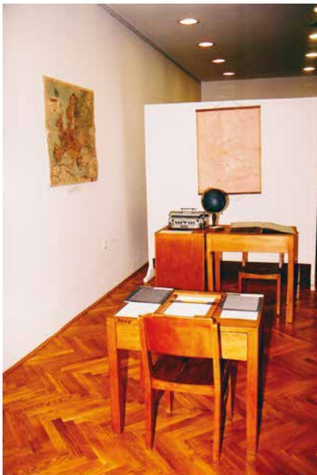
Stara geografska učilnica na razstavi Edina temà je neznanje v Pokrajinskem muzeju Kočevje.

V času postavitve razstave v Kočevju je bilo največ obiska med šolarji. Ti so bili najbolj navdušeni nad filmom Kaj se je Zvonko naučil , ker si niso mogli predstavljati, da lahko slepi invalid sam poskrbi zase, in pa nad delavnico s tipnimi slikami, ko so morali s tipom ugotoviti, kateri predmet je na sliki. Naučili so se tudi osnov brajvice in poskušali več kot do tedaj uporabljati tip, saj so si lahko ogledali – in otipali – slepim prilagojene družabne igre in knjige. Razstava je pozneje gostovala na Zavodu za slepo in slabovidno mladino in Zvezi društev slepih in slabovidnih Slovenije ter v Slovenskem šolskem muzeju v Ljubljani, v Škofji Loki, kjer je bila takrat še srednja šola za slepe in slabovidne otroke, in pa po krajih, kjer večinoma delujejo medobčinska društva slepih in slabovidnih – Kranju, Murski Soboti, Trbovljah in Novem mestu. Čeprav razen med šolarji ni bilo pretiranega obiska, je vsaj v krajih, kjer je gostovala, osvestila videčce, da so slepi del naše družbe in sveta, ki ga zaznavajo na specifičen način, in imajo pravico in željo sodelovati v muzejskih dejavnostih.