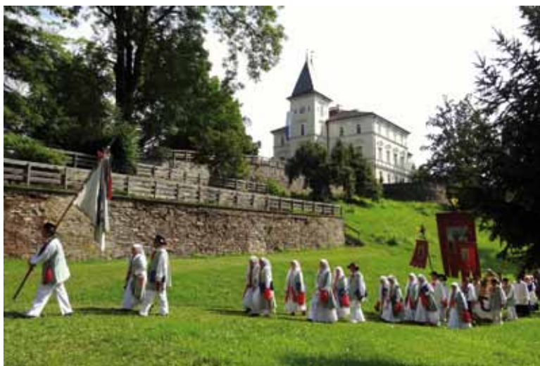
Procesija v okviru Kočevarskega kulturnega tedna pri gradu Krastowitz. Krastowitz, Celovec, Avstrija, 2011

Yorku in Gottscheer Kulturwoche v Celovcu. 19 Ker so prostori družbeno in kulturno determinirani, so takšne tudi ritualne prakse, ki se na njih odvijajo. Tako se ritualne prakse v ZDA in Evropi med seboj razlikujejo. Kot je ugotovila že Thomasonova (2010: 160–161), se na srečanjih in praznovanjih v ZDA (pa tudi Kanadi) veliko pleše in zabava, medtem ko so v Avstriji praznovanja predvsem religiozne narave. V vsakdanjem življenju Kočevarjev v stari domovini je cerkev igrala veliko vlogo, saj so bila mladostniki vsa praznovanja povezana s cerkvenim življenjem. Poleg cerkvenih praznikov (božič in velika noč) so praznovali še ob farnih žegnanjih in semnjih (Kiertog), popularna pa so bila tudi romanja k različnim cerkvam na Kočevskem pa tudi v oddaljene kraje, npr. v Trsat (pri Reki) in Brezje (Hutter 2012: 3). Večinoma so to bile Marijine cerkve. Avstrijski Kočevarji so, kot že rečeno, take krščanske rituale ohranili v večji meri kot ameriški, kar se odraža v izvedbi Kulturnega tedna, ki ga Kočevarji iz Celovca vsako leto od leta 1966 praznujejo na gradu Krastowitz. Osrednji dogodek je žegnanjska nedelja s procesijo s kipom Marije z zaščitnim plaščem (Schutzmantelmaddona), zaščitnice Kočevarjev.