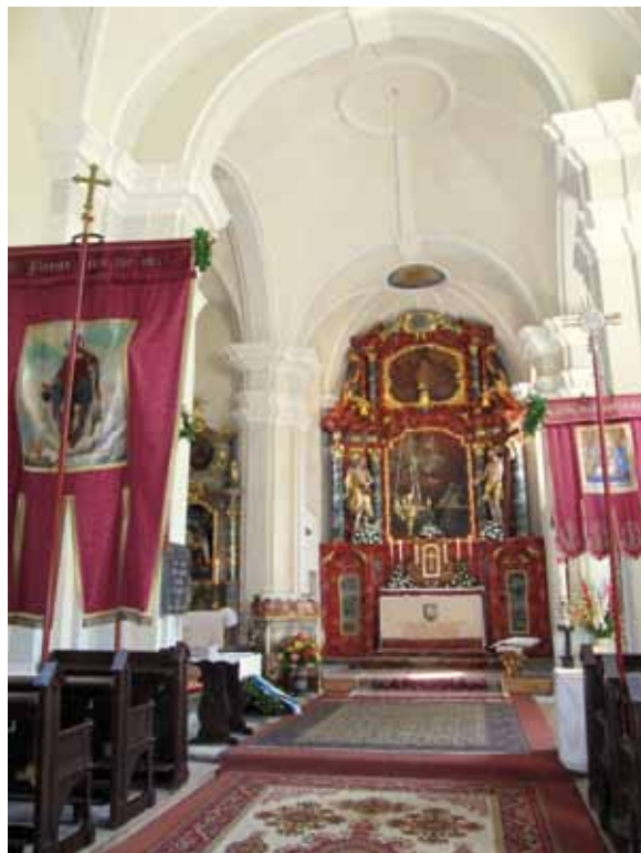
Notranjost cerkve pri gradu Krastovitz, v lasti kočevarskega društva iz Celovca. V cerkvi so bandere, zvon in kipi iz stare domovine. Krastovitz, Celovec, Avstrija, 2009

pročelju cerkve pa je kočevarski grb. Društvo je leta 1962 kupilo zemljo okoli cerkve in jo razglasilo za spominsko mesto. Cesta, ki vodi do spominskega mesta, se uradno imenuje "Gottscheer Straße" (Petschauer1984: 175).