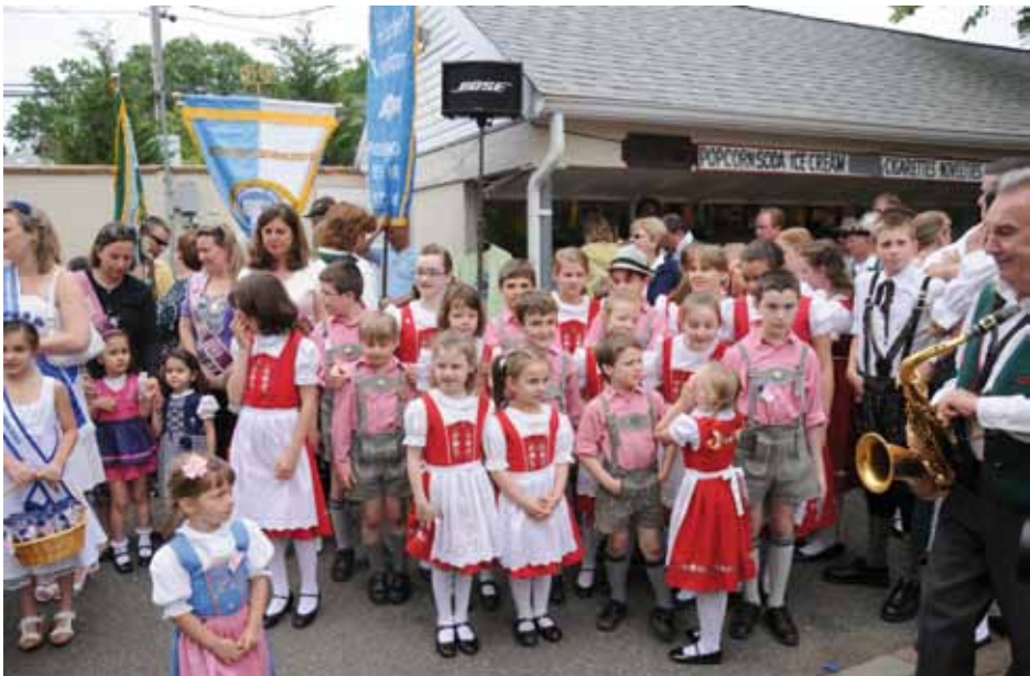
Sodelujoči na Gottscheer Volksfest v New Yorku. V ospredju je otroška plesna skupina. New York, ZDA, 2010

Rituali praznovanja v diasporičnih kočevarskih skupnostih reflektirajo staro domovino, jo simbolno nadomeščajo, vzpostavljajo vezi med člani skupnosti in skrbijo za kontinuiteto skupnosti. Na pomembnost tradicionalnih prireditev kot povezovalnega elementa, ki krepi kočevarsko identiteto, opozarja podatek, da večina Kočevarjev (76,5 %) z drugimi kočevskimi Nemci komunicira ravno pri prireditvah kočevarskih društev (OIK). Praznovanja v organizaciji društev so še posebno pomembna, ker pritegnejo tudi nečlane društev, saj se ti tudi udeležujejo večjih letnih srečanj. Po posameznih državah se delež nečlanov, ki komunicirajo z drugimi Kočevarji na prireditvah društev, giblje med 34 % in 65 % (OIK). Med nečlani društev, ki se udeležujejo tradicionalnih prireditev, so tudi pripadniki mlajših generacij, ki so ohranile zgolj simbolično etnično identiteto ali "simbolično etničnost" (Gans 1979), tako da se želijo "počutiti etnično" (Pleck 2000: 64), ne da bi živeli v etnični skupnosti, se znotraj nje poročali ali pripadali njenim organizacijam. Kljub temu pa ohranjajo nekatere običaje, npr. kuhajo ali uživajo tradicionalne jedi in se udeležujejo tradicionalnih prireditev in praznovanj (glej ibid. ).