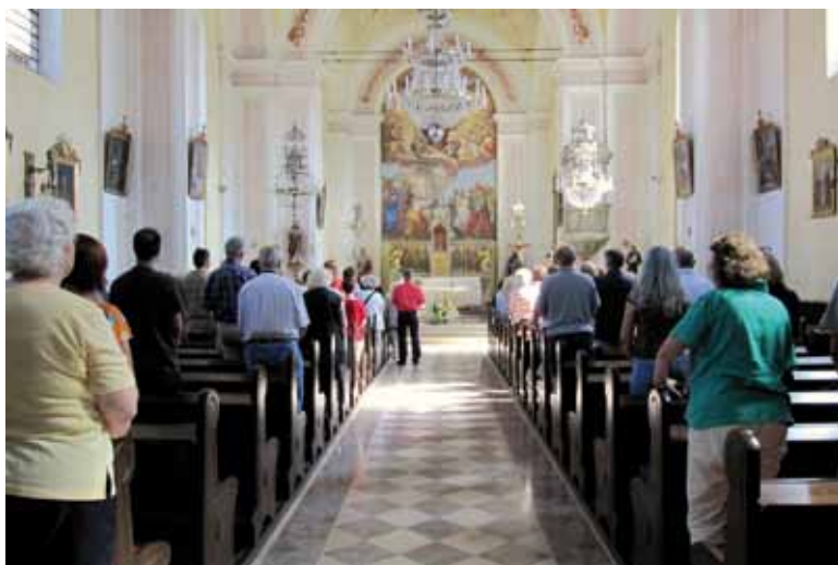
Obisk Kočevjarjev v stari domovini v okviru Kočevarskega kulturnega tedna, ogled cerkve v Stari Cerkvi pri Kočevju, ki jo vsakoletno obišče nekaj kočevarskih skupin pa tudi posameznikov. Stara Cerkev, Slovenija, 2009

Mnogi se za obisk bivše domovine ali domovine svojih prednikov odločijo v okviru izletov, ki jih običajno letno organizirajo kočevarska društva iz Avstrije in ZDA. Društvo iz Celovca tak voden izlet pripravi julija v okviru srečanja Kultur Woche, ameriško društvo GHGA pa vsakih nekaj let. Običajno si udeleženci ogledajo Kočevsko, poudarek pa je na obisku vasi in starih pokopališč ter na iskanju sledov prednikov (glej Mische 1995). Zadnja leta so “raziskovanju” Kočevske dodali še izlet na preselitveno območje v Posavju in Obsotelju, kjer obiščejo Posavski muzej Brežice in vasi, kjer so nekaj let živeli. Med nekaterimi Kočevjarji in nekdanjimi slovenskimi izgnanci s tega območja so se celo spletle prijateljske vezi.