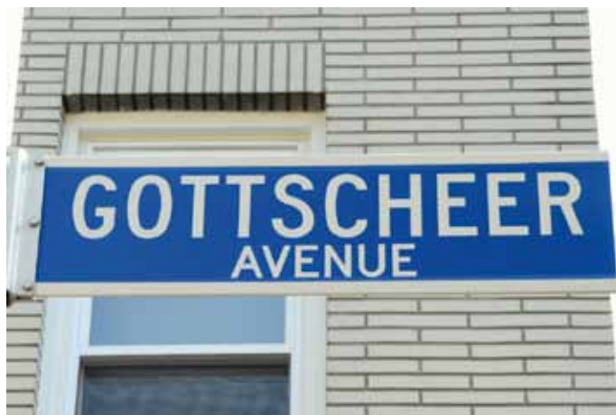
Napis Gottscheer Avenue pred stavbo Gottscheer Club v New Yorku. New York, ZDA, 2009

zgradile cerkev ali kapelico, ki so nekoč stale malodane v vsaki kočevarski vasi. 16 O simbolnem pomenu teh krajev za skupnost pričajo tudi njihova (uradna in neuradna) imena (npr. "Kočevarska ulica") in simboli, ki jih najdemo v klubih (slike, fotografije, grbi, zastave, spominski predmeti itd.). 17