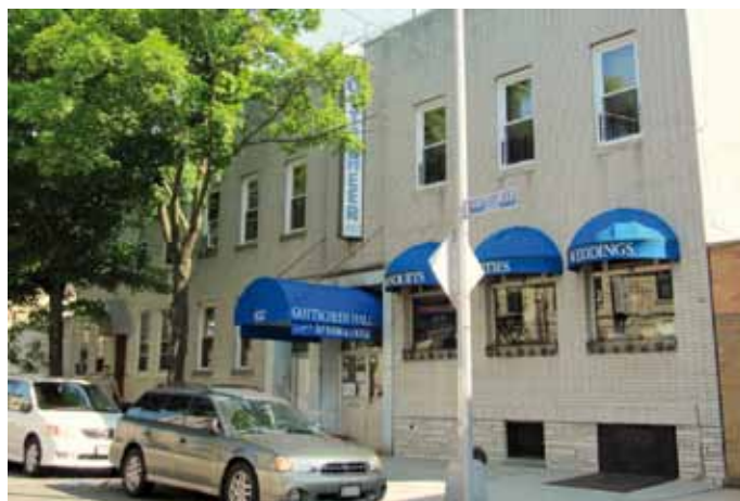
Poslopje Gottscheer Club v New Yorku, kraj srečevanja tamkajšnjih Kočevarjev. New York, ZDA, 2009